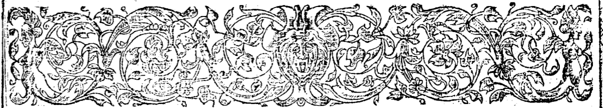
TABLA DE LOS CAPITVLOS DEL PRIMER LIBRO.