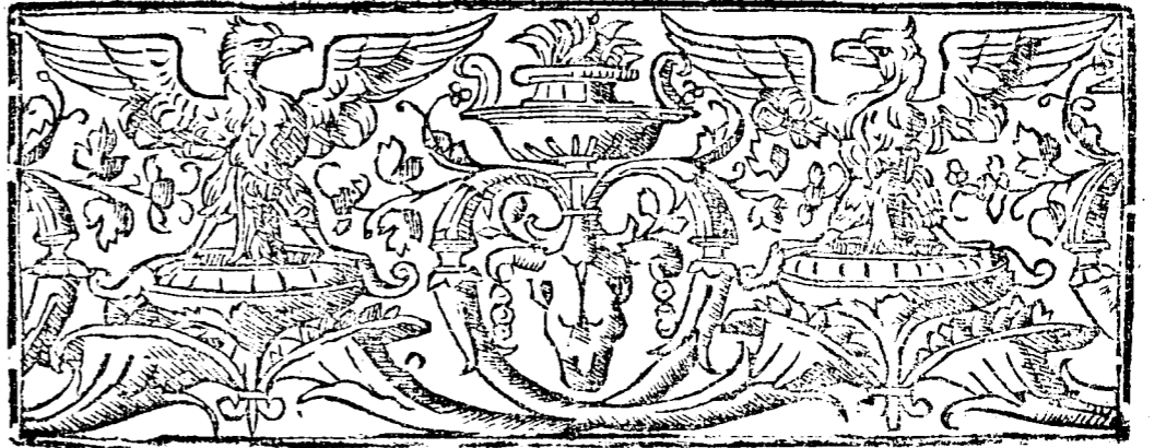
TABLA DE LOS CONVENTOS DE LA PROVINCIA DE ARAGON, DE LA ORDEN DE PREDICADORES, SE- GUN LA ANTIGVEDAD DE SVS FVNDACIONES.