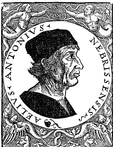
EIVSDEM ANTONII NEBRISSE ET ALIORVM GARMINA nonnulla exijs; quæ in imaginis ac illius artificum laudem scripta reperiuntur.