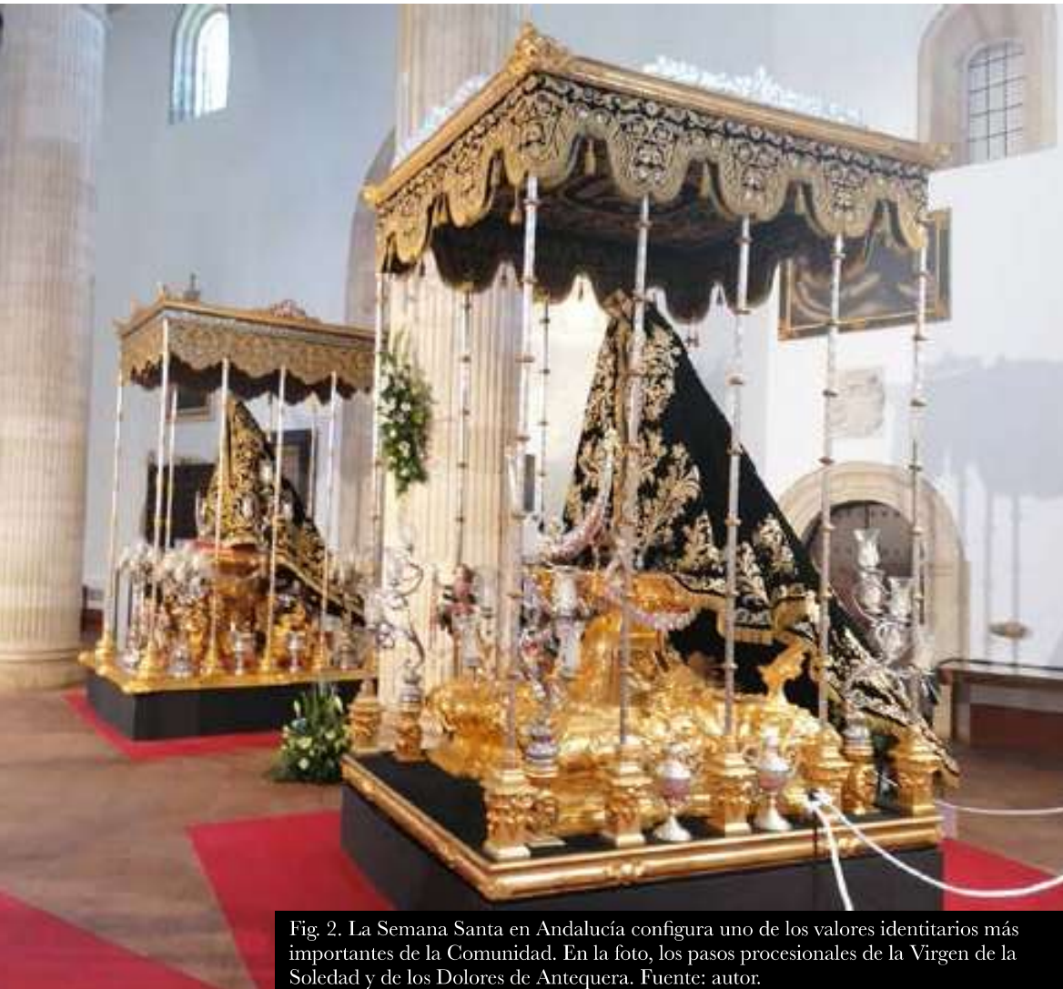
Fig. 2. La Semana Santa en Andalucía configura uno de los valores identitarios más importantes de la Comunidad. En la foto, los pasos procesionales de la Virgen de la Soledad y de los Dolores de Antequera.

menta muy particular. Durante la Semana Santa se celebra en Ríogordo la conocida como “El Paso”, en la que se reúnen actores escenificando la pasión y muerte de Jesús. Esta ceremonia es considerada Fiesta de Interés Turístico Nacional. Otra representación cultural con bastante impacto es la “Feria del Caballo de Jerez”, declarada de Interés Turístico Internacional, y propuesta como Patrimonio Cultural Inmaterial de España. Además, en la misma provincia se celebra El Carnaval de Cádiz también declarado como Fiesta de Interés Turístico Internacional. Éste se celebra en enero y febrero en el Gran Teatro Falla llevando a cabo el Concurso de Agrupaciones del Carnaval. La “Romería de El Rocío” es una de las fiestas más conocidas debido a la enorme peregrinación que realiza la gente en honor a la Virgen del Rocío celebrada el lunes de Pentecostés, consiste en la realización de un recorrido desde la hermandad de Almonte a la ermita de El Rocío. Además de las fiestas ya mencionadas, tiene una gran influencia “Invención de la Santa Cruz” también conocida como Cruz de Mayo o Fiesta de las Cruces es una fiesta en la que se celebra el culto a la Cruz de Cristo. Un acto celebrado en toda España, pero con una mayor influencia en Andalucía; por su perímetro costero, es la “Noche de San Juan” la cual era inicialmente un festejo pagano que celebraba la llegada del verano en el hemisferio norte, más tarde pasó a ser una fiesta cristiana por el nacimiento de San Juan Bautista.