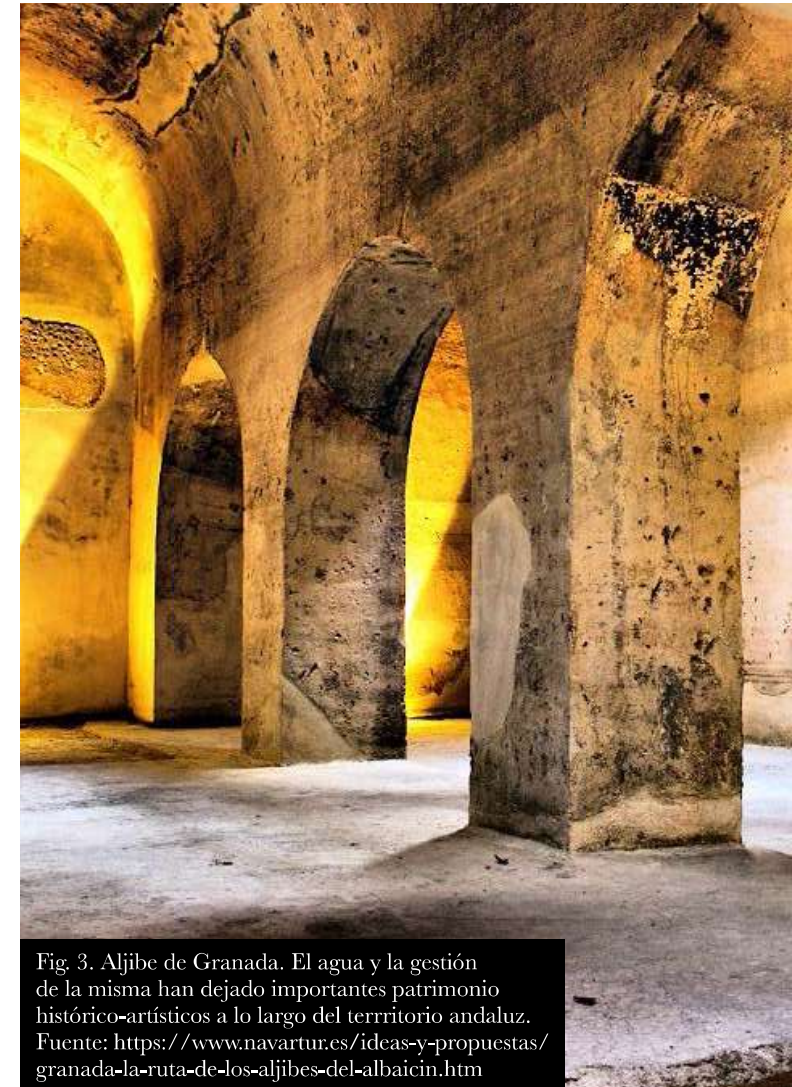
Fig. 3. Aljibe de Granada. El agua y la gestión de la misma han dejado importantes patrimonio histórico-artísticos a lo largo del territorio andaluz.

Estos criterios se aplican paralelamente a los objetivos propios de la cultura, que como hemos podido ver, son los objetivos 0. CS. 5, 0. CS. 7, 0. CS. 9 y 0. CS. 10.