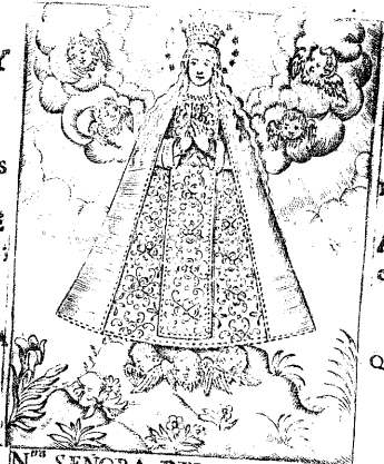
N ra SEÑORA DEL CARMEN