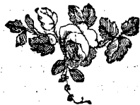
TABLA DE LOS CAPITULOS.