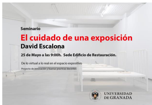
Fig. 1: Cartel de uno de los seminarios realizados en el marco del Proyecto de Innovación Docente.

- Divulgación y transferencia de los resultados: la metodología y los resultados obtenidos en este proyecto de innovación docente se han difundido en medios especializados como el Foro de Innovación Docente desarrollado en el marco del Plan FIDO UGR, y se pretende continuar con su divulgación en distintos medios. Asimismo, el propio discurso expositivo que se ha planteado supone una divulgación a la sociedad y a los visitantes del mundo del diseño expositivo, mostrando los distintos elementos que se suelen emplear en el montaje de una exposición.