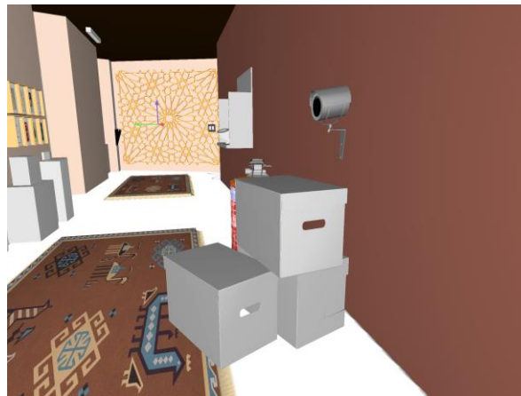
Fig. 3: Captura de pantalla de una de las propuestas expositivas realizadas en Dialux por el alumnado.