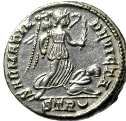
SARMATIA DEVICTA Constantino I