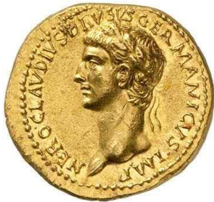
DE GERMANIS Nerón Druso Germánico