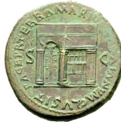
IANVM CLVSIT PACE P R TERRA MARIQ PARTA Nerón