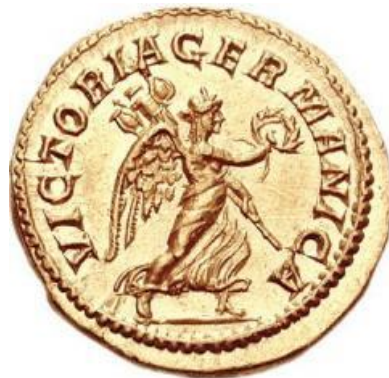
VICTORIA GERMANICA Caracalla