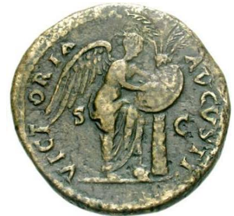
VICTORIA AVGVSTI Vespasiano