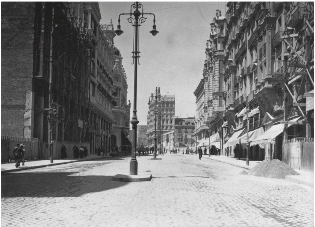
Figura 2: Salazar, Vista de la Avenida del Conde de Peñalver, Madrid, 1916. En primer plano, a la derecha de la imagen, edificio Gran Vía n.º 10 en ejecución.

Redacta el proyecto en diciembre de 1914, obtiene la licencia de obra en marzo de 1915 y su certificado de fin de obra en septiembre de 1916. Los certificados de instalaciones se consiguen entre abril y agosto de 1917, para finalmente tener la licencia de alquiler en noviembre de 1917 (fig. 2).