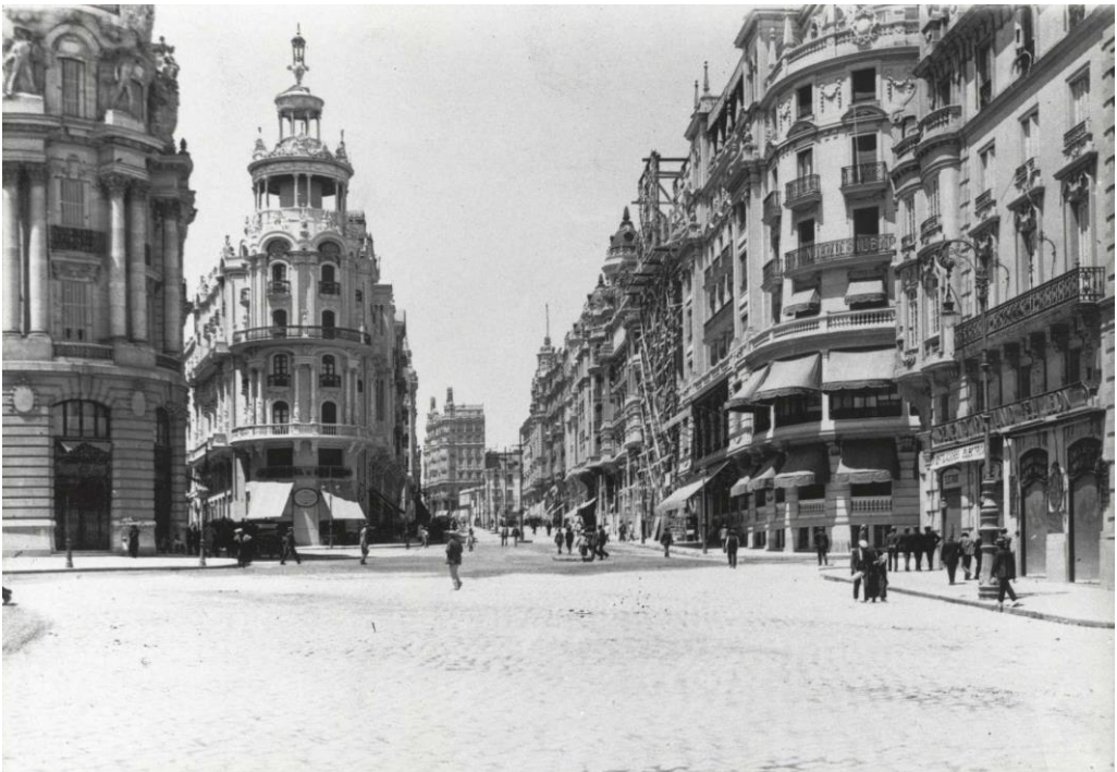
Figura 1: Salazar, Vista de la Avenida del Conde de Peñalver , Madrid, 1917 (Archivo General de la Administración. Medios). Centrado, a la derecha de la imagen, edificio Gran Vía n.º 10 finalizado con su torre con cúpula.

En 1917 se encontraban demolidas todas las fincas y finalizadas las obras de urbanización, del primer tramo Alcalá - Red de San Luis, denominado Avenida del Conde de Peñalver (fig. 1).