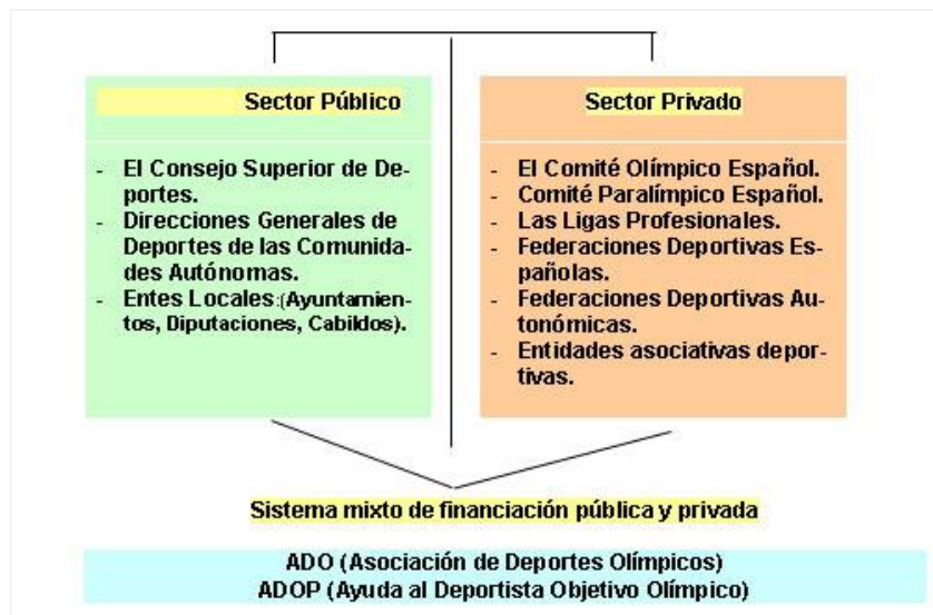
Gráfico 1. Estructura organizacional de deporte institucionalizado a nivel español (CSD 2017)

En la estructura del deporte a nivel nacional en nuestro país ( Error! Reference source not found. ), las asociaciones deportivas emanadas de la LD 10/1990, son aquellas entidades de base asociativa, integradas por personas físicas o por personas jurídicas, que tienen como finalidad esencial participar, practicar o fomentar la actividad deportiva y que están sometidas a un régimen especial (Fuentes, 1992). Todas ellas se encuentran tuteladas por el CSD, órgano deportivo de la administración del Estado y por tanto el de mayor rango en nuestro país, siendo además el agente coordinador de las administraciones deportivas autonómicas.