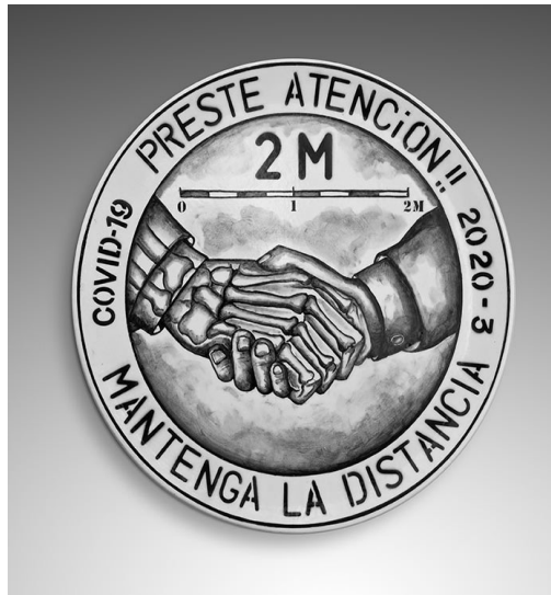
Figura 6. “PRESTE ATENCIÓN, MANTENGA LA DISTANCIA” 4

La Figura 4 es una de las piezas del proyecto “La ciudad especular” de Xavier. La misma refleja el descontento causado por los políticos estadounidenses en aquel momento. Las Figuras 5 y 6 corresponden a su proyecto “Covid-19”, cuyas piezas fueron hechas en su mayoría con la técnica de bajo cubierta con pigmentos o pinturas minerales. Esta técnica utiliza diferentes pinturas para pintar sobre las piezas de cerámicas horneadas, y luego vitrificarlas en horno para terminar la cocción. La mayoría de las obras de Xavier reflejan directamente el mundo actual o los acontecimientos más importantes de su vida. Algunas son muy irónicas y revelan directamente los problemas de la sociedad. Así agrega su estilo único y su marca artística a las cerámicas, haciéndolas lucir más artísticas y decorativas.