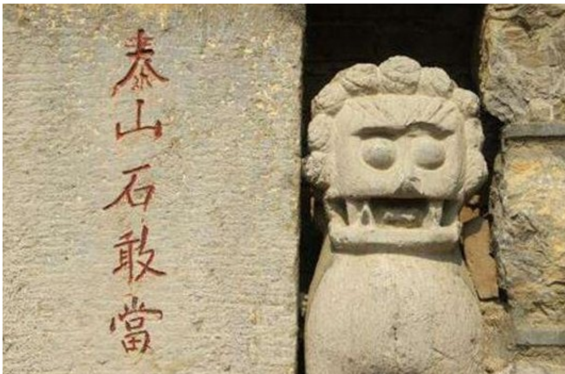
Figura 7. Shigandang y la piedra de león en China 5 .