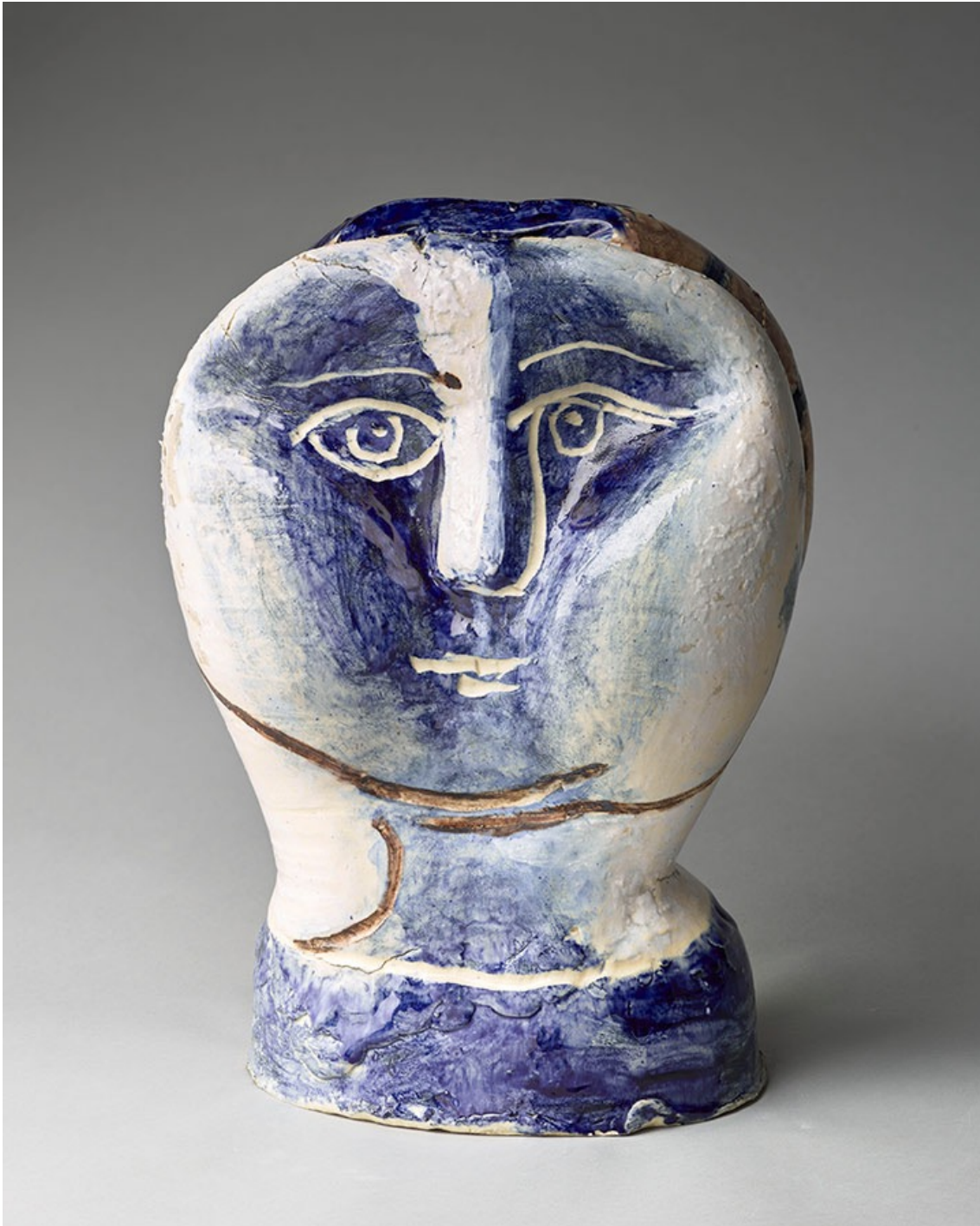
Figura 2. “Cabeza de mujer con rejilla”, 1948 – 1950, Vallauris. 36,5 x 25,5 x 22,5 cm. Museo Nacional Picasso.

DOI: https://dx.doi.org/10.17561/rte.extra6.6525 Investigación