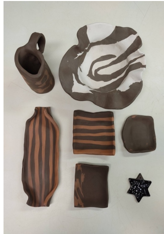
Imágenes I y II

La idea del trabajo en la imagen superior proviene de la ciudad natal del autor, Chengdu, el pueblo de oso panda. Allí, este animal es considerado uno de los símbolos más representativos de la ciudad. La técnica utilizada es pigmento sobre cubierta.