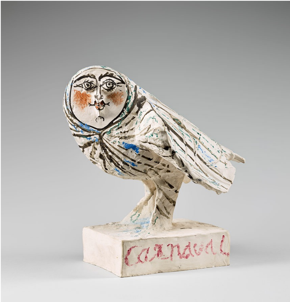
Figura 1. “Carnaval”, 1951 – 1953, Vallauris. 33,5 x 34,5 x 24 cm. Museo National Picasso – Paris