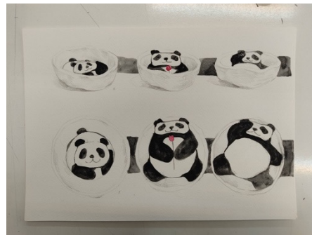
Imágenes III y IV