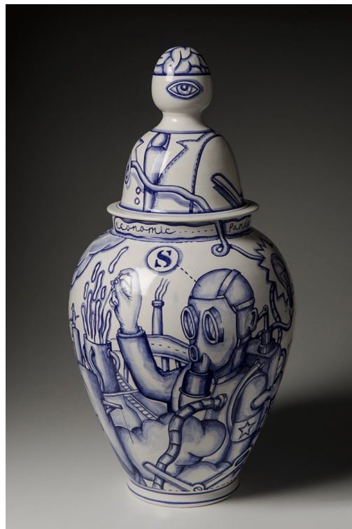
Figura 5. “CRISIS” 3