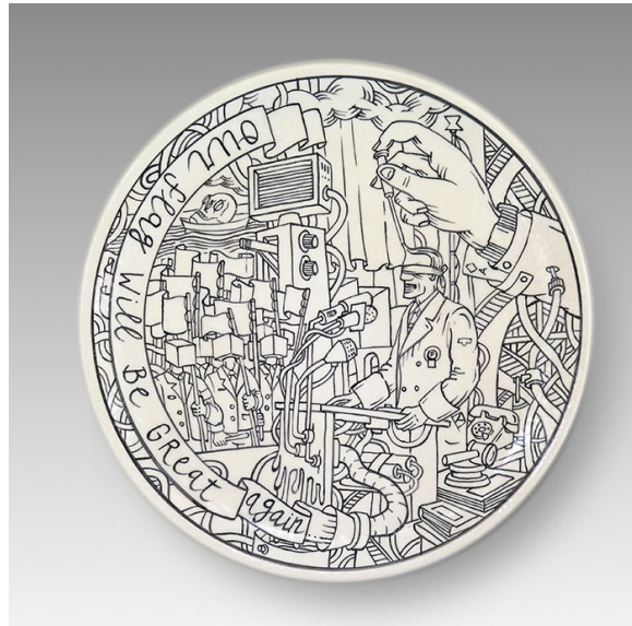
Figura 4. “Our flags will be great again” 2