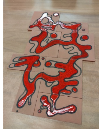
Imágenes V, VI y VII