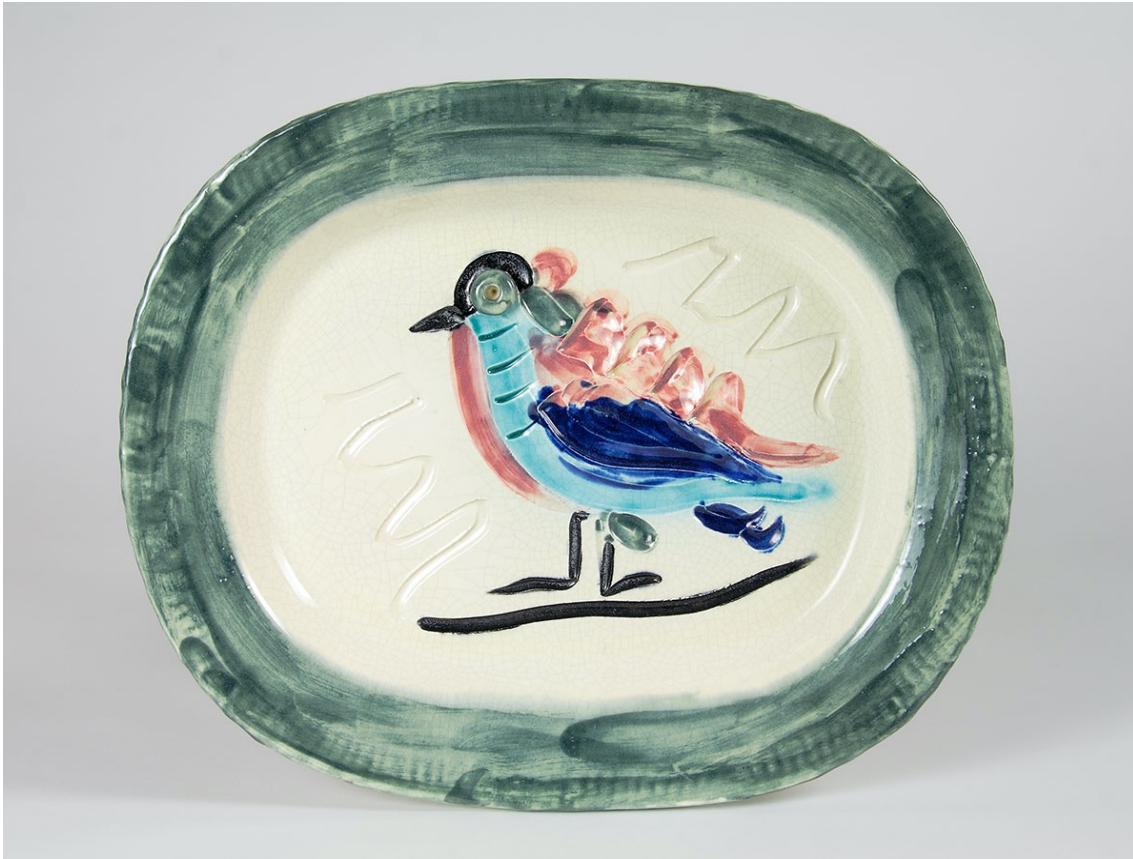
Figura 3. Pablo Picasso, “Pájaro policromo”, manufactura Madoura, Vallauris (Francia) 31,4 x 38,8 cm.

Las imágenes presentadas anteriormente son del Museo Nacional Picasso de París. Sus obras tienen fuertes características personales y muy contemporáneas. Entre ellas, se encuentra una gran cantidad de obras con dibujos de palomas blancas, toros, mujeres, etc. Como se muestra en las tres figuras de arriba, estas obras se diferencian de otros productos cerámicos que usamos a diario, ya que tienen caracteres contemporáneos y muy artísticos. En aquel momento, la Segunda Guerra Mundial acababa de terminar y Picasso se vio profundamente afectado por esa guerra. Por lo tanto, se cree que la gran cantidad de vez que aparece representada la paloma blanca en sus obras, como en las Figuras 1 y 3, estaría representando su anhelo de paz. La figura de las mujeres en sus obras representan su respeto y el amor hacia ella, y el toro es el símbolo de España. Estos trabajos hicieron que el autor tuviera un gran interés por la cerámica, dando origen a esta investigación.