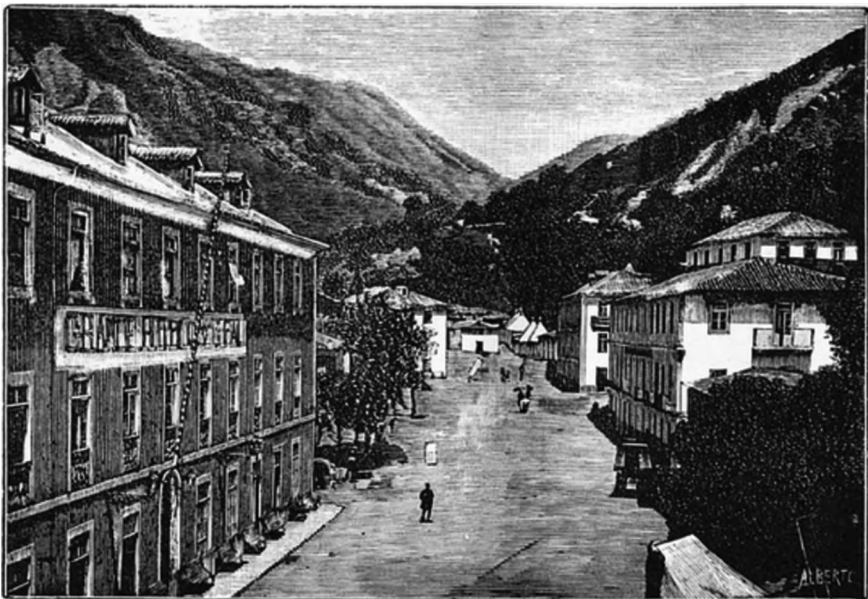
Figura 3. Aspecto das Caldas do Gerês em 1891. Fonte: Jorge, Ricardo. Caldas do Gerês. Guia termal. Porto: Tip. da Casa editora Alcino Aranha; 1891, [s.p].