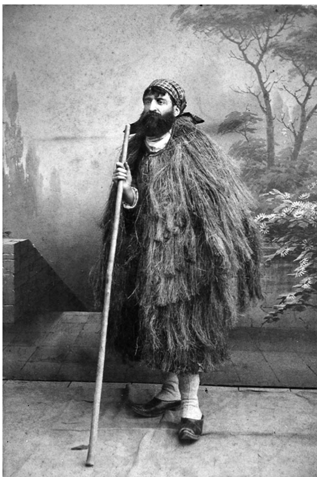
Fig. 1. Ricardo Jorge com traje regional dos pastores do Minho.

proficiência pelo segundo dos requerentes [Ricardo Jorge], que constitui o mais sumptuoso e perdurável monumento erguido à singular excelência daquelas águas, e ocupa, com incontestável e incontestado direito o primeiro lugar na bibliografia geresiana, e porventura e de toda a bibliografia hidrológica nacional» 34 .