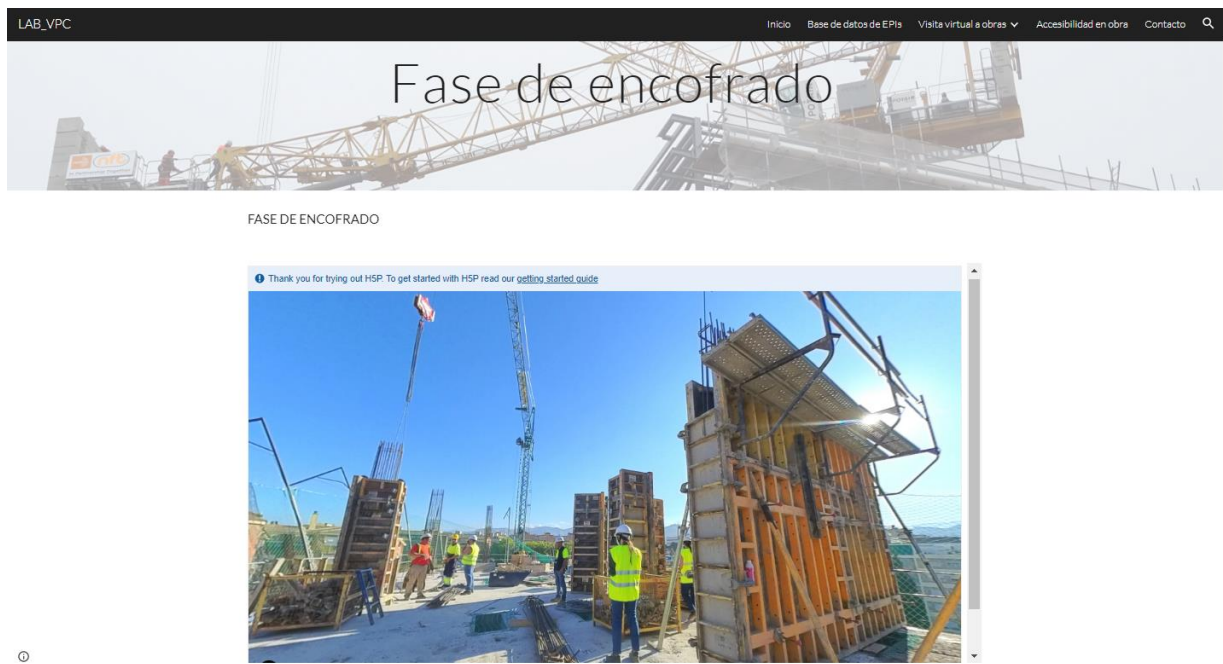
Figura 3. Ejemplo de escenario virtual inmersivo. Ejemplo: Fase de encofrado.