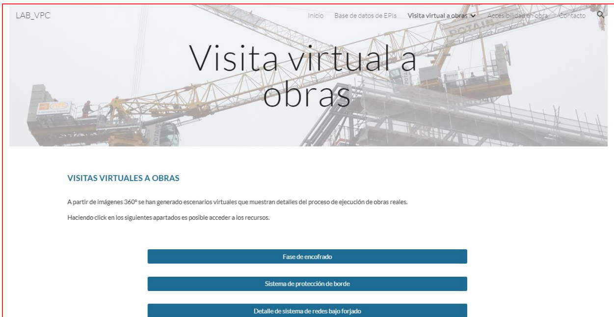
Figura 2. Sección de visitas virtual a obras de construcción.