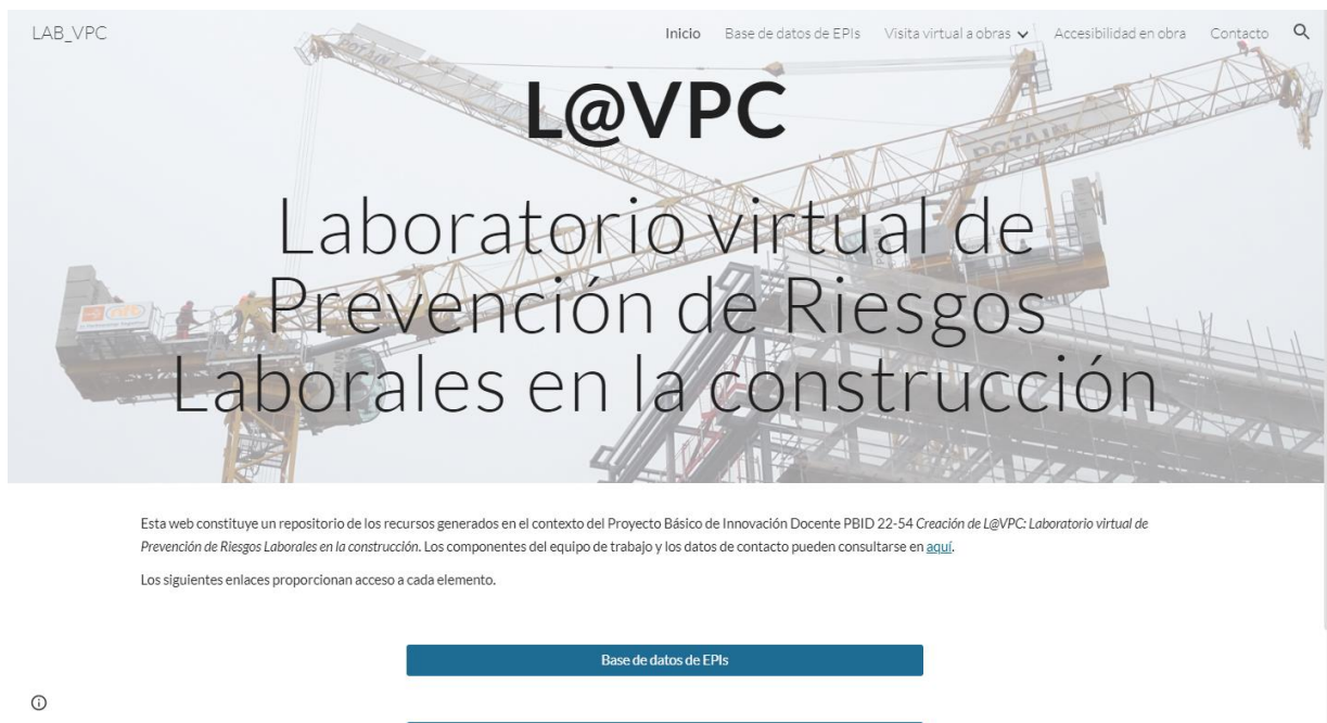
Figura 1. Página principal de la web desarrollada.

Como resultado del PBID 21-54 se han generado nuevos instrumentos de transferencia del conocimiento integrados en el laboratorio virtual L@VPC. Los escenarios digitales inmersivos han sido creados a partir de grabaciones realizadas en escenarios reales de ejecución de obras. Esta metodología de grabación de itinerarios ha permitido que el alumnado pueda visualizar los recursos de forma inmersiva (es decir, el estudiante es un espectador que tiene el control de la visualización en tiempo real, generando así un escenario de realidad virtual que evoluciona conforme avanza). Al estar basado en imágenes reales, el estudiante puede analizar un escenario real como si se encontrara en el mismo emplazamiento donde se realizó la grabación. Su visualización no se encuentra limitada al uso de dispositivos de realidad virtual, sino que también puede visualizarse utilizando dispositivos con pantallas 2D (ordenadores, portátiles, tabletas, Smartphone, etc.) ya que los visores en estos dispositivos incluyen botones para interactuar con los elementos y navegar en estos escenarios envolventes (ver Figuras 1-4).