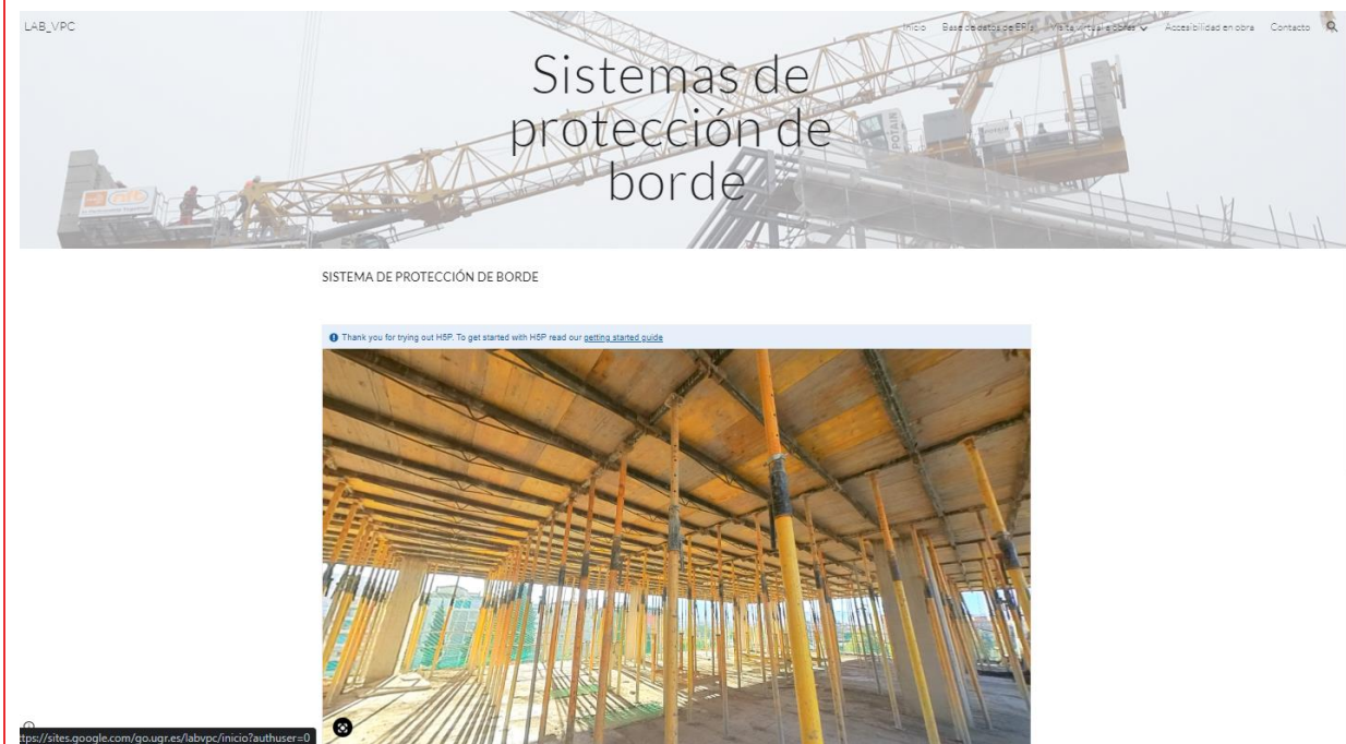
Figure 4. Immersive virtual scenario. Example: edge protection systems.

It should be noted that the generated resources also include two databases developed through the collaborative work of the students. On the one hand, the database of Personal Protective Equipment, in which the students analyzed its use, regulations and functionality on construction sites. On the other, the database Con otra mirada , in which each student contributed their assessment of a real construction site, focusing on Occupational Risk Prevention, from the "eyes" of a safety manager (see Figure 5).