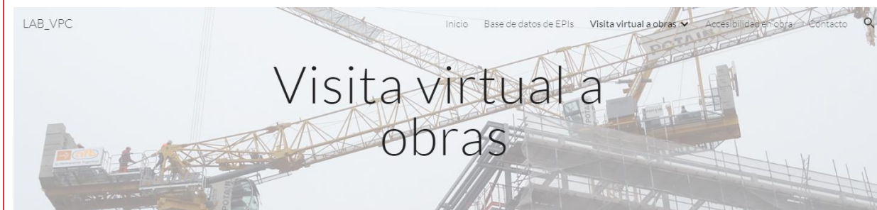
Figure 1. Main page of the website.