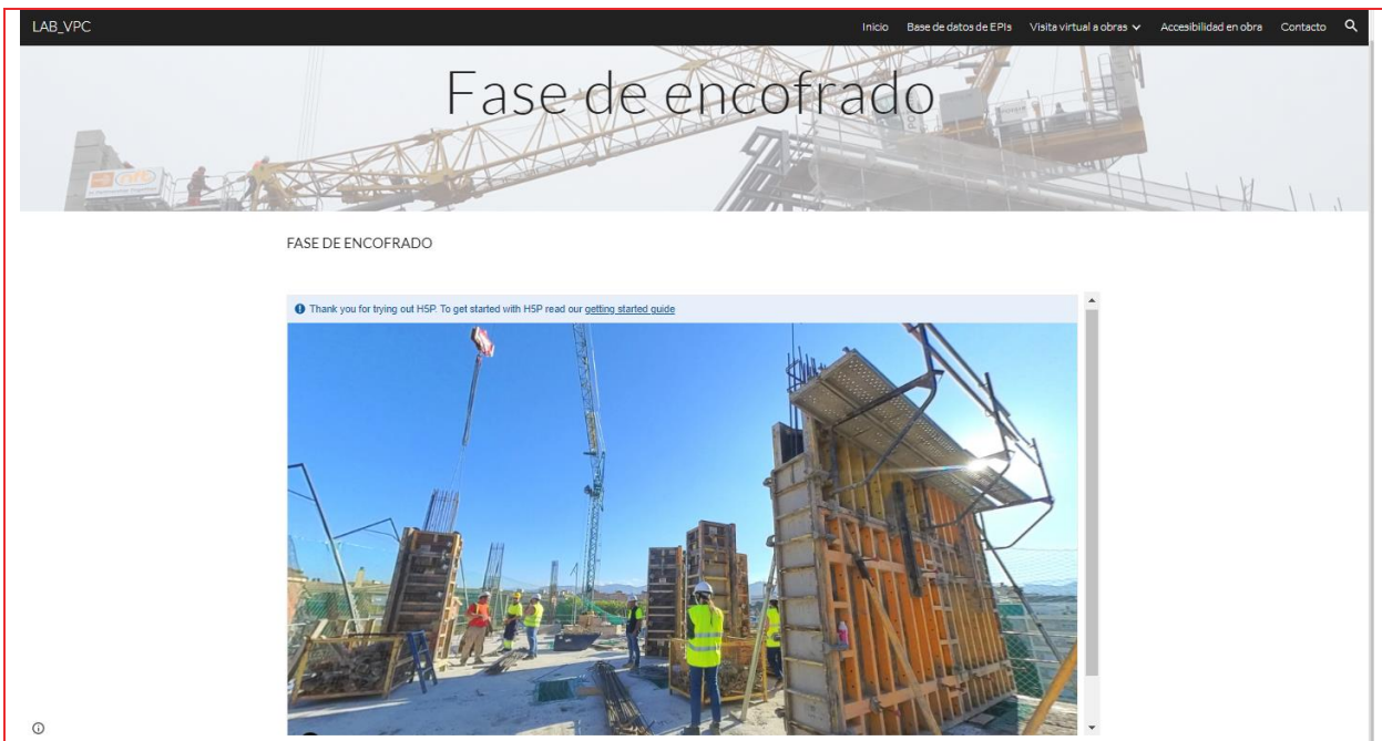
Figure 3. Immersive virtual scenario. Example: Formwork phase.