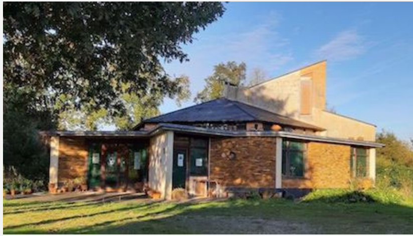
Centro de elaboración, demostración y venta en la actualidad bajo la consideración de la alfarería como patrimonio.