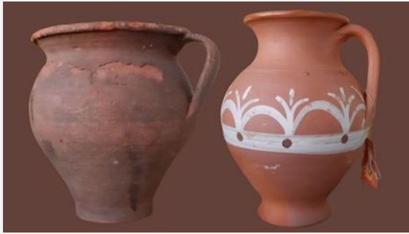
Púcaros elaborados en talleres de la zona norte de la provincia de Lugo antes de 1960 y después de 1990.