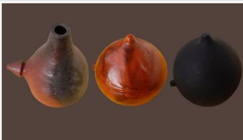
Progresiva asimilación de los rasgos diferenciadores de la alfarería de Gundivós (Lugo) sobre una pezoira desde la introducción de esta pieza en la zona a comienzos del siglo XXI.

identidades locales en la era de la globalización. Ofrece, pues, una respuesta diferente y complementaria a la de la interpretación de la artesanía tradicional como una representación de la autenticidad de una cultura, de corte hasta cierto punto romántico. Este fenómeno postmoderno del recurso a la tradición como principio reactivo o resistente a la uniformización cultural propio de la consideración de la cultura como una red diversa y heterogénea y, al mismo tiempo, como una dinámica en constante elaboración y construcción, no dependiente en exclusiva del recurso al pasado y al museo, funcionaría como una respuesta a la fragmentación o fractalización baudrillardiana , al ofrecer una posibilidad de resemantización y reelaboración de lo colectivo en aras de una cultura identitaria: “Esa ficción tan líquida como fracturada, permite tonificar las mercancías transnacionales. Los territorios, esos lugares imaginados, luchan por entrar en los circuitos financieros del capitalismo cognitivo. Y las memorias, esos sueños evocados, se convierten en narrativas imposibles de autenticidad” (Santamarina y Mármol 2020).