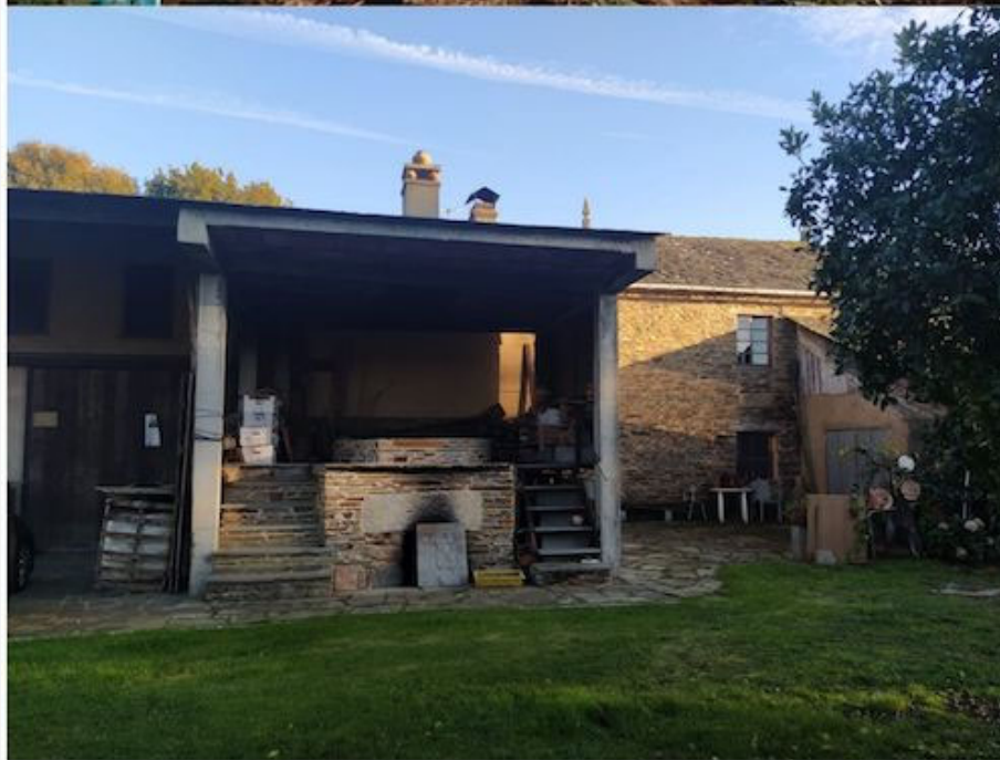
Horno tradicional situado en la parroquia de Bonxe (Outeiro de Rei, Lugo) antes y después de su remodelación propiciada por la Diputación Provincial con fondos europeos (1998/2021).