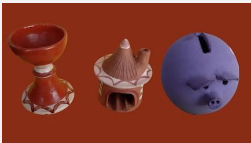
Piezas de alfarería elaboradas en Galicia bajo la denominación tradicional.

Así pues, la alfarería tradicional gallega patrimonializada ejemplifica la transición entre la representación de la cultura material perteneciente al pasado de un pueblo y la pervivencia del oficio en la sociedad actual en dos espectros diferenciados. En uno estaría el mundo institucional que refrenda a través de su estudio, exposición y divulgación la existencia de la alfarería gallega como un referente identitario que ha alcanzado, en los últimos tiempos, y gracias a ese amparo, un espacio propio en la representatividad más elevada de la sociedad gallega, visible en la ocupación de espacios específicos como icono publicitario y de propaganda institucional, cultural, etc., o por su ubicación dentro de los circuitos comerciales oficiales, al pasar a instalarse en emplazamientos específicos dentro de los museos públicos, o por el hecho de haber acaparado un cierto ámbito del mundo comercial, dentro de un sector específico como es el de las artesanías.