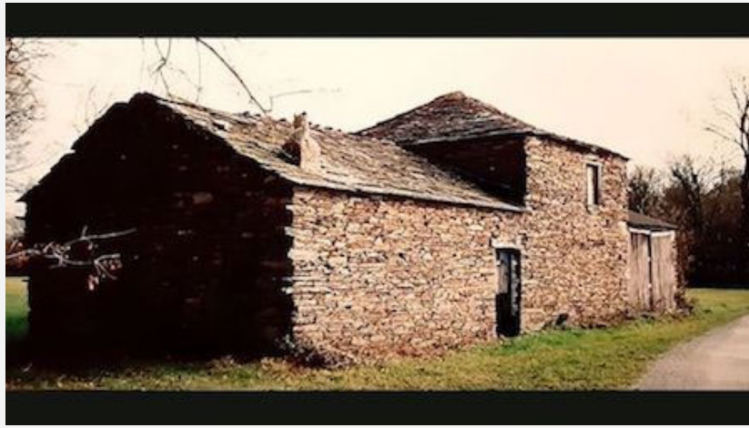
Vivienda-taller en Bonxe construida en el primer tercio del siglo XX.