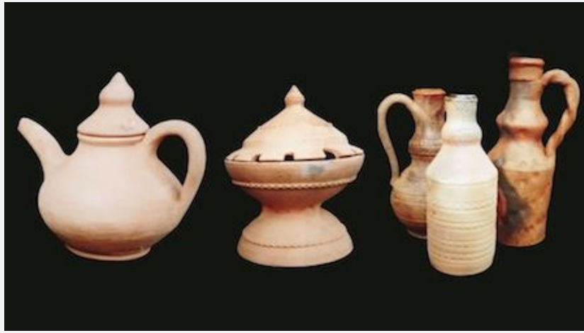
Diferentes piezas elaboradas en Gundivós, año 1999.

Curiosamente, en los casos mencionados la pervivencia del oficio o, cuando menos, su aguante ante la adversidad provocada por la caída de las ventas, no estuvo relacionada con la posibilidad de una consideración social hacia los productores de un oficio relegado en la escala social al sector primario y rural (valores muy apreciados ahora mismo pero denostados en aquel momento), sino vinculado con una producción industrial o con una actividad que incluso podemos clasificar cómo lúdica, más allá de la necesidad económica de subsistir cuando las artesanías en general, y dentro de ellas también la alfarería, suponían en el mundo tradicional dedicaciones vinculadas a la actividad económica y su existencia posibilitaba un modo de vida para quien desempeñaba el oficio. En todo caso, resulta innegable que durante ese período de la segunda mitad del siglo XX la alfarería gallega atravesó una etapa de silencio en la que muchos artesanos abandonaron definitivamente el oficio y que supuso la ruptura entre los dos momentos productivos a los que puede pertenecer cualquier pieza catalogada, indistintamente, como alfarería tradicional gallega.