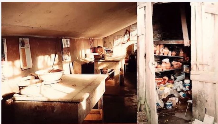
Lugar de producción, almacenamiento y venta de piezas en distintos talleres antes del proceso de puesta en valor acometido a comienzos del siglo XXI.