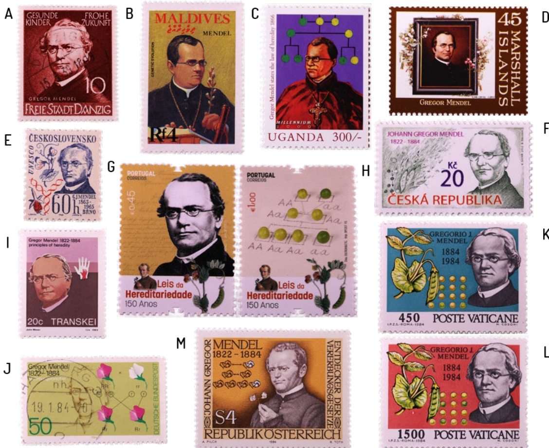
FIGURA 1. Sellos a escala 1:1 dedicados a Mendel emitidos por: (A) Danzig, (B) Las Maldivas, (C) Uganda, (D) Islas Marshall, (E) República Checa, (F) Checoslovaquia, (G, H) Portugal, (I) Transkei, (J) Alemania, (K, L) Ciudad del Vaticano y (M) Austria.