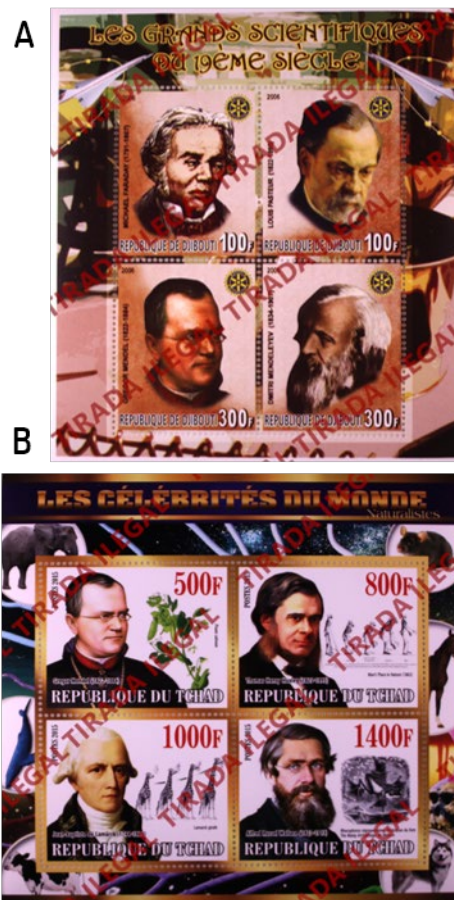
FIGURA S2. Series de sellos ilegales a escala 1:2 que incluyen a Mendel atribuidos a: (A) Yibuti, que incluye, aparte de a Mendel, a Michael Faraday, Louis Pasteur y Dimitri Mendeleiev y (B) El Chad, en la que aparecen, junto a Mendel: Huxley, Lamarck y Wallace. Nótese la alternancia en el uso del inglés y el francés en las leyendas de estos sellos.

Durante la preparación de este trabajo, he detectado la existencia de dos sellos ilegales relacionados con Gregor Mendel. Se trata de sellos con el nombre de países o territorios que no han autorizado ni su impresión ni su emisión. En concreto, existe un sello de Mendel producido en nombre de Yibuti (2006), con un valor facial de 300 francos perteneciente a una supuesta serie dedicada a los grandes científicos del siglo XIX, Les grands scientifiques du 19ème siècle (Figura S2-A).