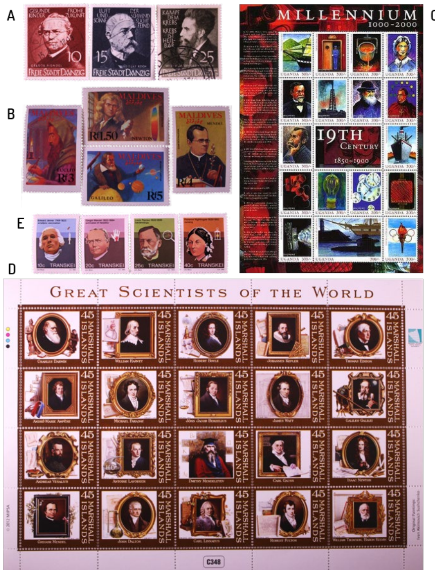
FIGURA S1. Sellos dedicados a otros científicos que forman parte de series temáticas en las que, también, aparece Mendel. Todos a escala 1:2 (salvo (C) obtenido de http://www.worldstampcatalogue.org ): Sellos emitidos por: (A) Danzig, (B) Las Maldivas, (C) Uganda, (D) Islas Marshall y (E) Transkei.