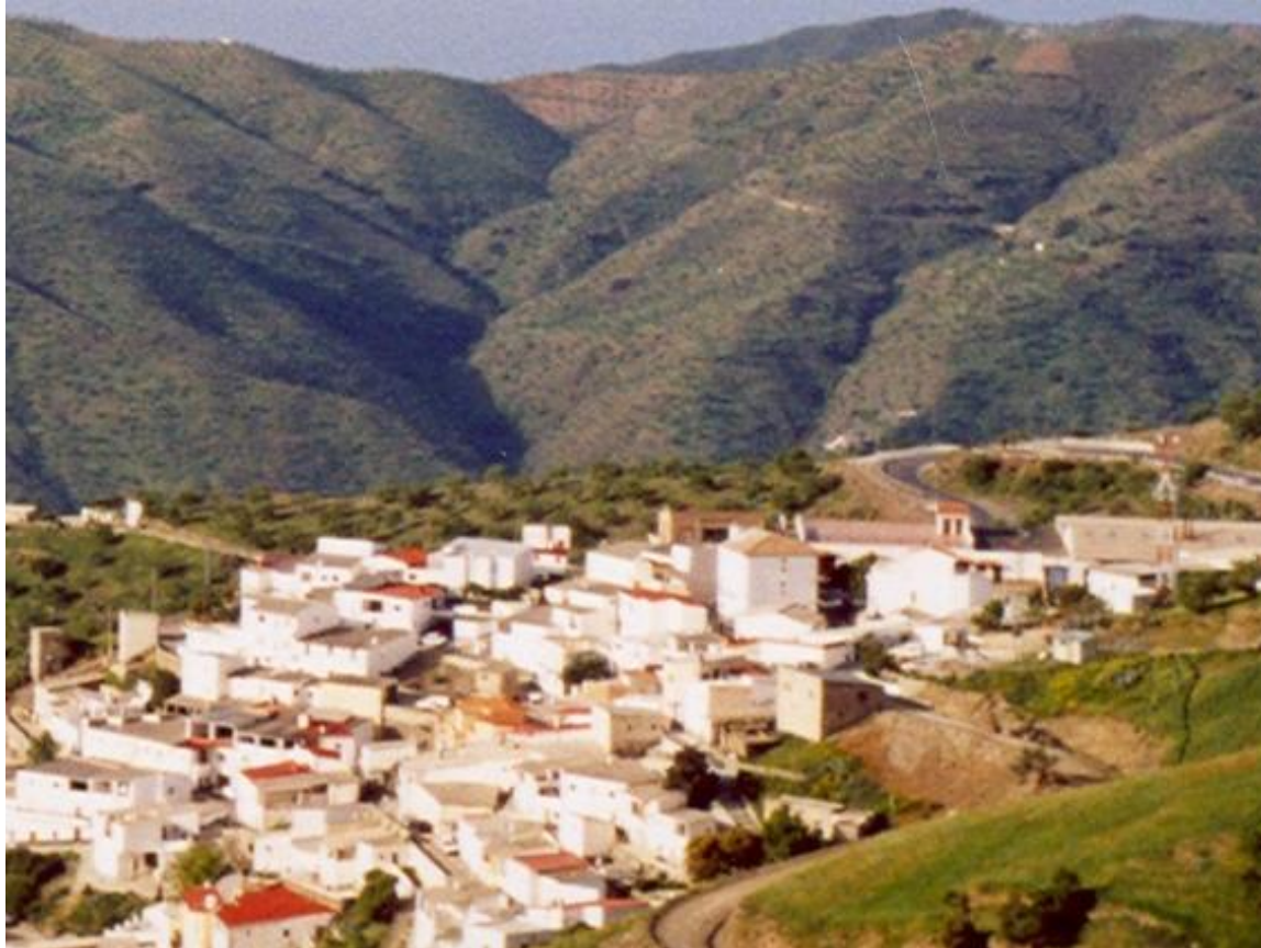
Alpujarra de Granada