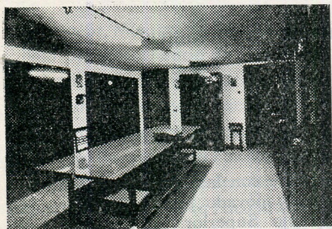
Sala del Herbario de la Cátedra

ascender a unos mil pliegos el total del material existente, pero que constituía un estimable núcleo para la formación de una colección que pudiese llenar las necesidades de la enseñanza.