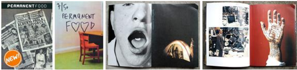
Fig. 6 Permanent Food .

ellos distinto, sin un diseño preestablecido. En esta publicación, no hay apenas textos y, cuando aparecen, se convierten en citas esporádicas que refuerzan un concepto.