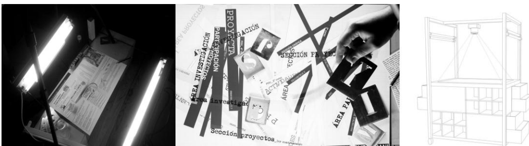
Fig. 2 Proceso. Mesa de trabajo y primeras pruebas de las páginas del Boletín.

De aquí que el Boletín Proyecta esté concebido como las antiguas mesas de montaje de la imprenta sobre las que se agolpan de forma azarosa papeles, fotografías, fotolitos, diapositivas e imágenes para ser luego mostradas tras un proceso de recomposición basado en el recorte y el collage . El Boletín Proyecta es también una acción, en este caso editorial, que se inicia con la construcción física de una estructura soporte sobre la que se amontona información diversa y múltiple generada por la actividad de los docentes y en la que se acumulan fragmentos de docencias de unos y otros que, vistos en conjunto, crean ciertas relaciones de complementariedad con una fuerza expresiva mayor que la que ofrece cada docente por separado. El Boletín Proyecta trata también del valor que adquieren las cosas presentadas de una determinada manera. Un collage de ideas, actitudes y acciones orientadas a registrar las cosas y acontecimientos que suceden día a día en torno a la docencia, y que tiene el interés de ser testimonio de un presente que se desvanece sin dejar apenas rastro de cómo enseñamos y de cómo aprendimos en un momento determinado.