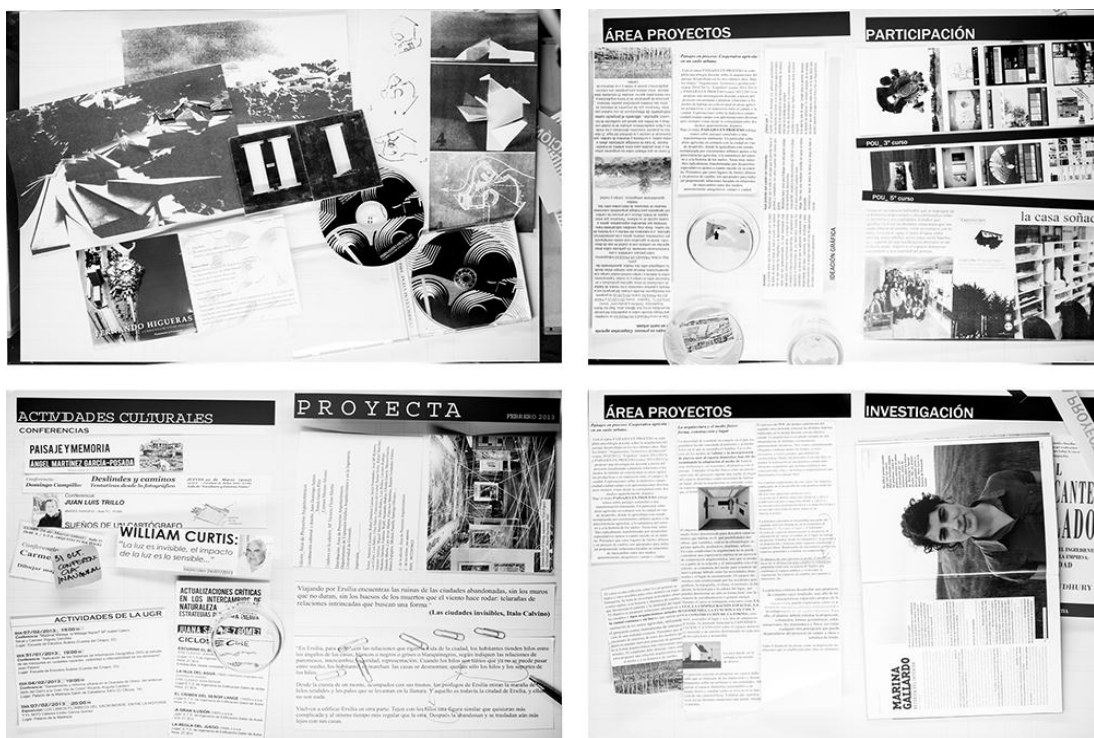
Fig. 4 Primeras pruebas de maquetación de páginas para el Boletín.

Concebido con un cierto aire vintage se edita preparado para ser manipulado y personalizado por el usuario que puede dibujar, tomar notas sobre sus páginas o reutilizar como mantel, póster, recortable de arquitectura o pasatiempo. Un cierto tono de juego impregna sus páginas que invitan a la participación, al mismo tiempo que se convierte en un anuario de acontecimientos y actividades que alternan con los contenidos docentes de la asignatura, las curiosidades que rodean el aprendizaje de la arquitectura y el ocio. El Boletín Proyecta se realiza con una sencilla metodología de edición que combina el montaje digital con el collage fotográfico. Con la intención de volver al origen en los procedimientos, gran parte de la maquetación se realiza de forma manual con una máquina fotocopidora. Hoy el ordenador ha convertido ciertas acciones, como recortar y pegar, en sencillas órdenes mecánicas, perdiendo la sorpresa creativa de lo que acontece en el proceso de montaje sin estar planificado.