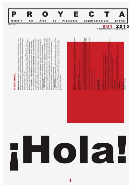
Fig. 1 Portada Boletín Proyecta 1.

El Boletín Proyecta es una publicación periódica semestral, editada desde el año 2015 por el Área de Proyectos Arquitectónicos de la Escuela Técnica Superior de Arquitectura de Granada, que trata sobre asuntos docentes. Su finalidad es proporcionar información de interés para los estudiantes y profesores de arquitectura, creando un estado de opinión y de aprendizaje sobre el conjunto de ideas y temáticas vertidas en las asignaturas de proyectos arquitectónicos. Un vehículo de comunicación para poner en contacto a personas con cosas, cosas con personas, y personas con personas.