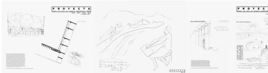
Fig. 8 Colección de carpetas para guardar los boletines de cada curso (2015-2019).