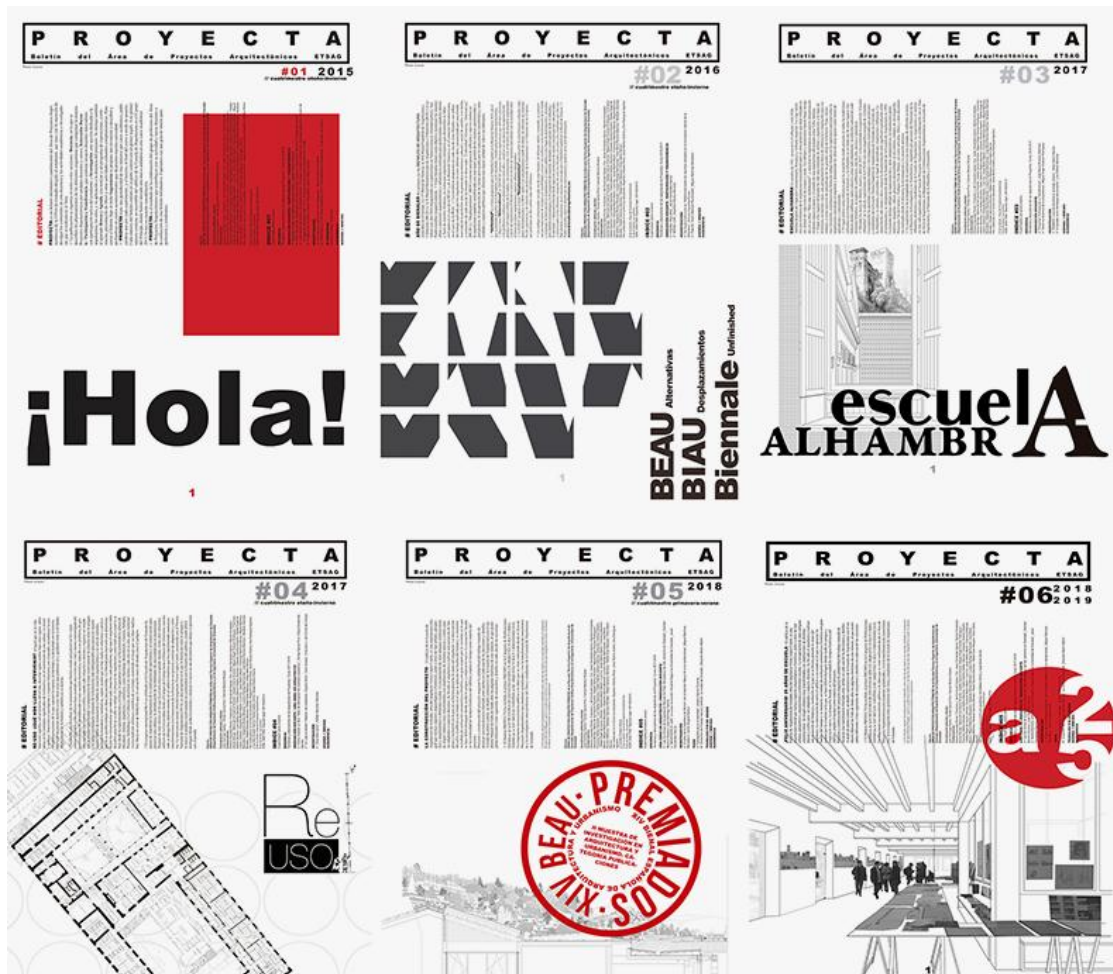
Fig. 9 Colección de portadas de los números editados del Boletín Proyecta hasta la fecha actual (2015-2019).