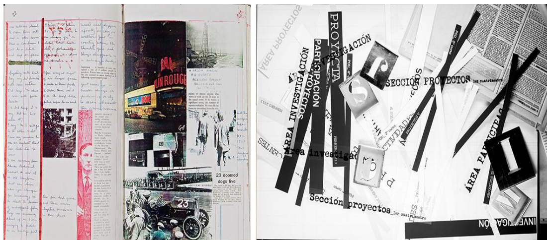
Fig. 7 Cut-Up de William Burroughs vs Collage Proyecta . Fuente: Varias

La libertad con la que aparece el dibujo en el Boletín, sirve también para incentivar a los estudiantes a dibujar sobre sus páginas con dibujos que surgen de manera espontánea, como aquellos que solemos hacer mientras hablamos por teléfono o mantenemos una conversación. Dibujos que, combinados con el texto y las imágenes, configuran una publicación que no es un mero soporte de lectura, sino un objeto en transformación con el que poder interactuar. El propósito es romper los límites del lenguaje, tal y como William Burroughs (1914-1997) nos enseñó a través de sus diarios personales. El escritor y artista americano convirtió su obra literaria en una continua experimentación con la intención de eliminar la narración lineal. Para ello utilizaba una escritura fragmentaria que mezclada con fotografías, recortes de periódicos o anuncios publicitarios, daba como resultado un objeto artístico en lugar de un simple libro. El Boletín Proyecta pretende convertirse, en este sentido, en un soporte "interactivo" para el estudiante que puede personalizarlo con libertad, transformar la publicación en una especie de scrap book que incorpora anotaciones propias incitando al aprendizaje personal.