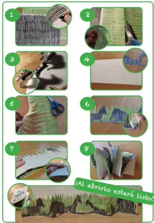
Ilustración 6: Secuenciación de los pasos para la construcción del libro con animales

Para que la actividad fuera más atrayente, se realizaron varios ejemplos de mayor y menor complejidad que sirvieran de modelo a aquellos que se animasen a llevar a cabo esta actividad en casa. De entre los ejemplos realizados, señalamos un libro con animales de la sabana que pensamos que podría ser interesante y atrayente debido a su parecido con el cuento y película Disney de El rey León , ( Ilustración 7 ) empleando cartulinas de colores y efectuando planos diferenciados con siluetas más complejas. Por otra parte, dada las posibilidades que nos ofrecía esta actividad virtual, también se diseñó un vídeo 2 corto en formato stopmotion colgado en YouTube con enlace directo desde la actividad generada y realizado con las sombras proyectadas de pitufos de juguete (Lucero, 2016).