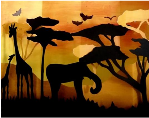
Ilustración 7. Ejemplo de libro con animales: La sabana/ Imagen: Ana Isabel Calero Castillo.