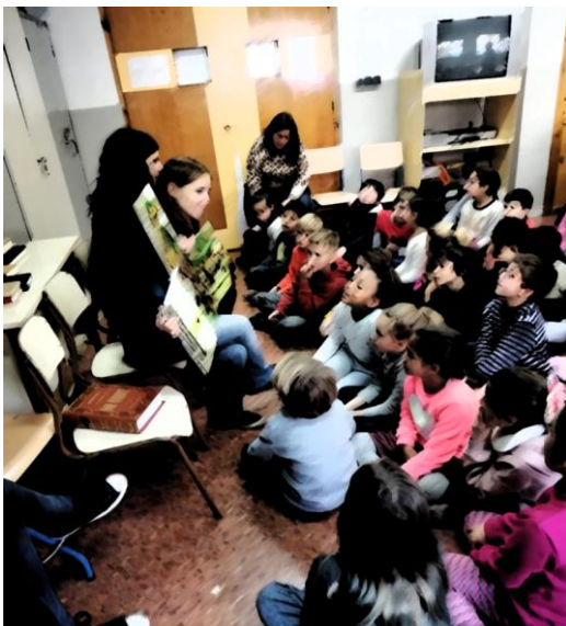
Ilustración 1: Imagen de la disposición del alumnado en uno de los talleres ofrecidos al CEP El Carmelo de Granada.

Las acciones que realizamos en ellos suelen dividirse por edades, adaptando el contenido, dependiendo de los asistentes, ya que todas ellas tienen en cuenta las características del alumnado al que van dirigidas, así como las posibles barreras o limitaciones que pudieran surgir durante su desarrollo.