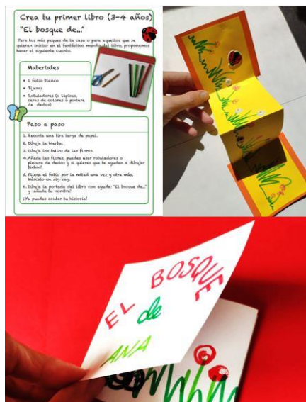
Ilustración 5: Secuenciación de los pasos para la construcción del libro bosque de... y libro acabado.

Una vez terminado, se invita a que cada persona que lo realice, personalice su propio cuento y su propio bosque ( Ilustración 5 ).