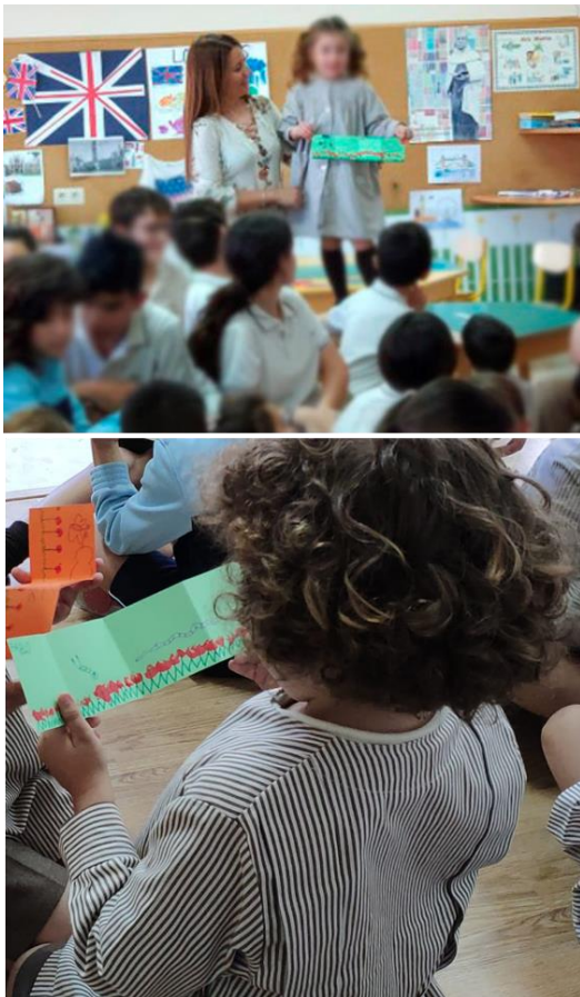
Ilustración 2: Alumnos de primaria y secundaria participando en la actividad del Libro acordeón. CEP El Carmelo de Granada/ Fotografía: Ana María López Montes.

Una de las variantes que en ocasiones se ha introducido en esta actividad y que ha resultado muy positiva, ha sido la de incorporar a la tarea a un grupo mayor del mismo colegio (de 1º a 4º ESO). El objetivo en este caso ha sido el de implicar a los alumnos de esta etapa con los más pequeños, de manera que asistiendo a la primera parte de la actividad teórica en círculo y atendiendo a las directrices de las personas que presentan la actividad, son ellos los que se encargan de ayudar a los más pequeños en la realización de su libro acordeón. Esta forma de trabajar hace responsables de manera indirecta al grupo más mayor (ESO) de los más pequeños (infantil) resultando con ello, el intercambio de conocimiento y un excelente comportamiento por parte de ambos grupos ( Ilustración 2 ).