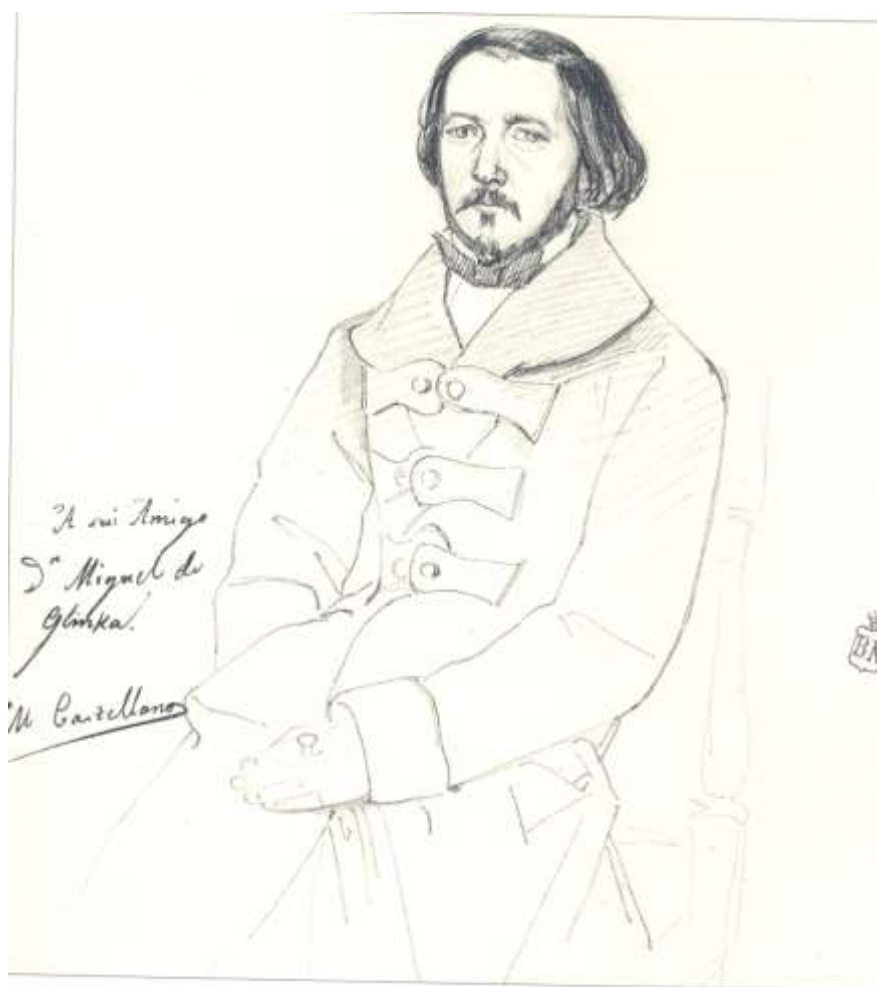
Retrato a lápiz de Mihail I. Glinka de Manuel Castellano, “noviembre 1845”. Biblioteca Nacional de España