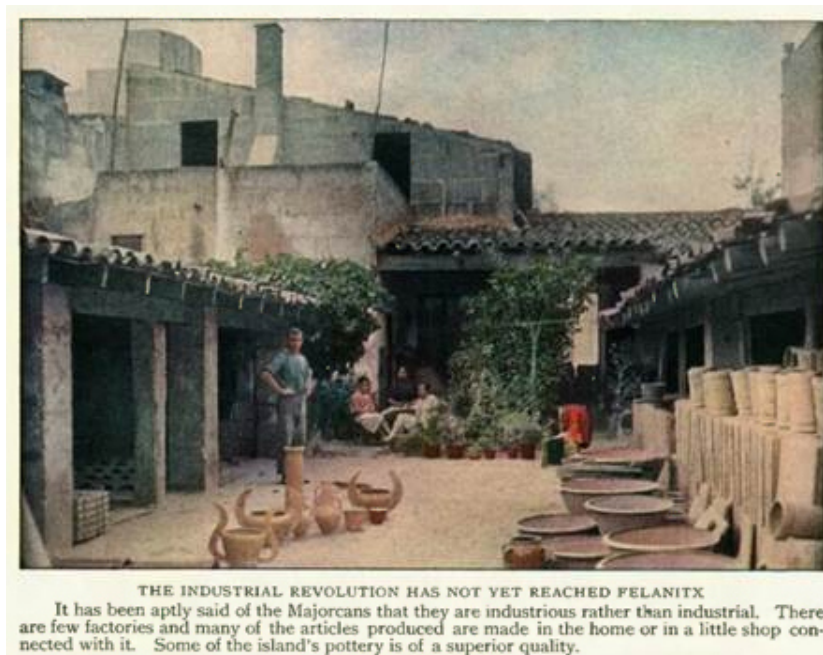
Figura 1: Jules Gervais-Courtellemont, Vivienda en Felanitx

Algo semejante sucede con los autocromos del francés Jules Gervais Courtellemont, publicados en 1928, 5 acompañando el texto del cónsul estadounidense en Barcelona Roy W. Baker. Conocedor de las estrategias de reclamo visual para el espectador y turista norteamericano, Courtellemont utiliza con insistencia fondos de casas rurales para representar sus escenas de trabajo, aunque también destaca algún patio interior destinado a la producción alfarera, enfatizando la ausencia en la isla de procesos industriales (Figura 1).