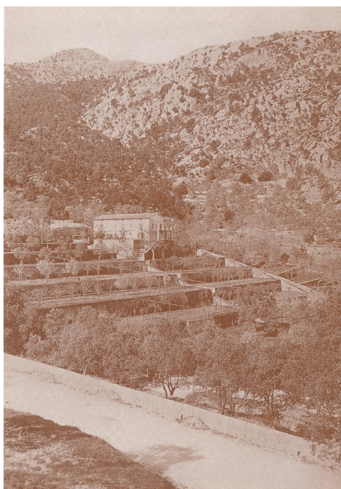
Figura 3: Arthur Byne, Casa entre bancales, carretera de Sóller , 1920

Fuente: Arthur Byne y Mildred Stapley, Casas y jardines de Mallorca (Palma: José J. de Olañeta Editor, 1990)