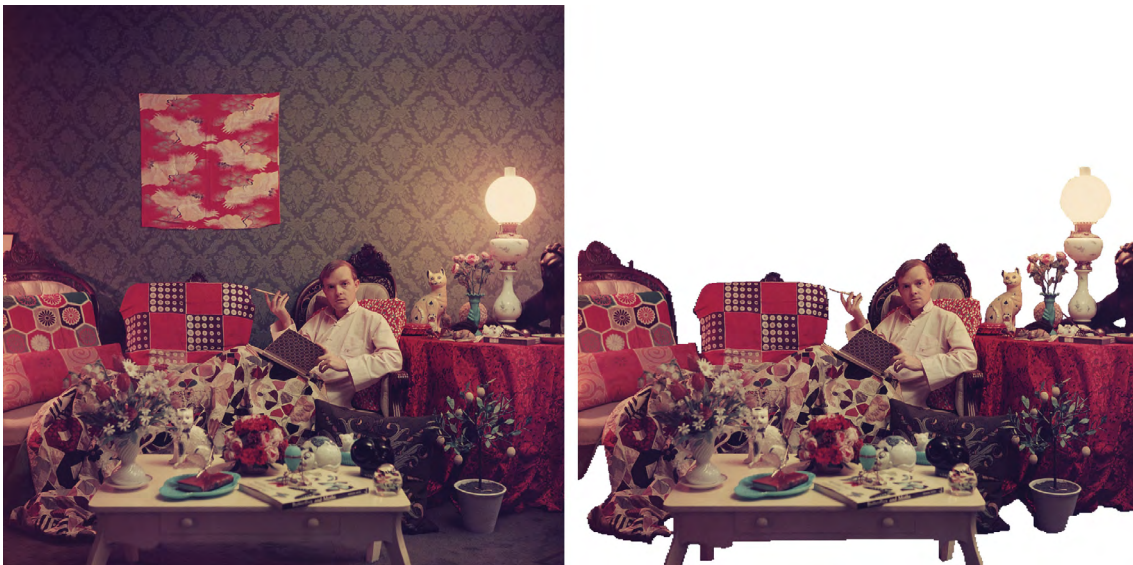
Figura 1.1: Slim Aarons, Capote at Home (1958)

En el estudio de este lugar de encuentro entre arquitectura y literatura, resulta necesario comprender, entre otros aspectos, los contornos o el contexto en que se desarrollan las actividades implicadas, es decir, la interpretación de los espacios del lector y del escritor. Para ello, es preciso explorar la forma que posee el escritor de apropiarse del espacio, a menudo doméstico, o de conformar un espacio específico para escribir. En ese sentido, podemos cuestionar hasta qué punto el entorno inmediato del escritor puede afectar a su escritura o si, de alguna manera, el modo en el que éste escribe está trasluciendo algún aspecto de su forma de entender la literatura. Se trata de una hipótesis de partida que sitúa el foco de atención en la comprensión de los espacios íntimos, una suerte de micro-arquitectura abierta y espontánea que nos aporta información valiosa para comprender las actividades humanas.