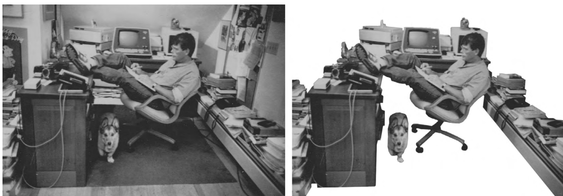
Figura 5.1: Anónimo, Stephen King at his desk (década de 1990)