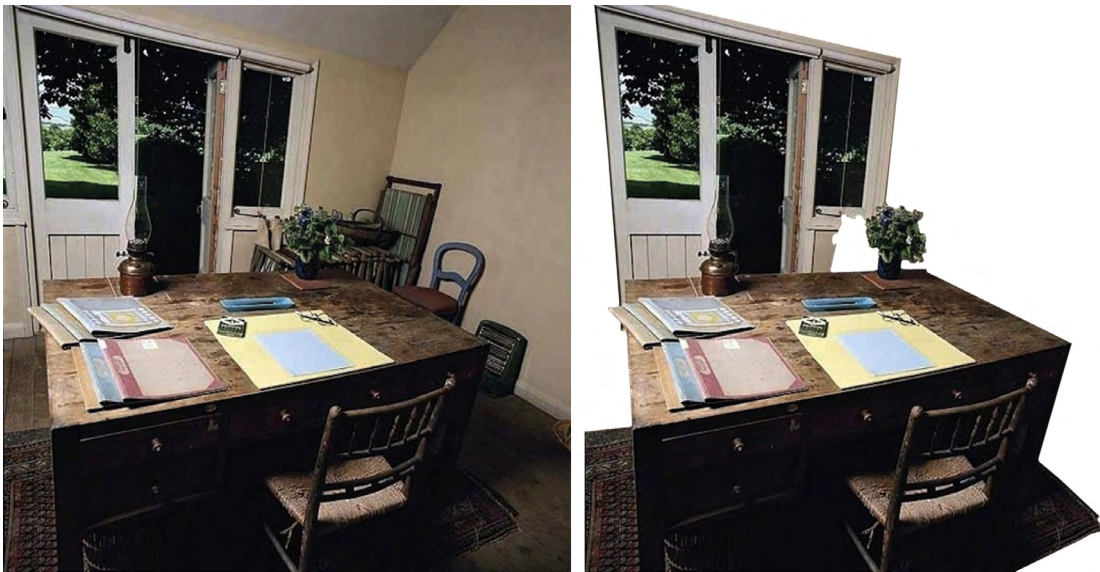
Figura 6.1: Eamon McCabe, Writers' Rooms: Virginia Woolf (2008)