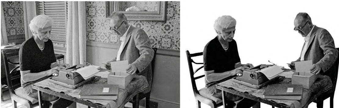
Figura 2.1: Carl Mydans, Vladimir and Vera Nabokov at their office (1958)

en escudriñar los detalles de cada documento sobre sucesos y casos reales que terminaría mezclando junto a la ficción en su obra, enmarcada en el género de novela-testimonio. Podríamos ver también algo de su actitud estafalaria, introvertida, pero a su vez capaz de mostrar una gran pose literaria con ciertos tintes cinematográficos gracias a su forma de apoyarse sobre el sofá; quizás algunos rasgos que muestran su interés por la naturaleza, como las cubiertas de los libros de mariposas o el gato y las flores; la actitud públicamente homosexual que mostró Truman e incluso la atmósfera evasiva provocada por el humo del tabaco. Podríamos ver también ese ámbito de apropiación del espacio cargado de contenido en una fotografía de Vladimir Nabokov (Figura 2) realizada por el fotógrafo Carl Mydans. Resulta evidente aquí la importancia de la presencia de su esposa Vera, que estuvo ayudándole en su actividad creativa, conformando una mesa de escritura para dos, un espacio compartido, o la combinación en la fotografía de ciertos aspectos de la afición a la entomología, el coleccionismo y la clasificación de elementos, a través del archivador sobre el escritorio. En este sentido, resulta tan importante la labor del escritor como la de su mujer, íntimamente ligada a su actividad.