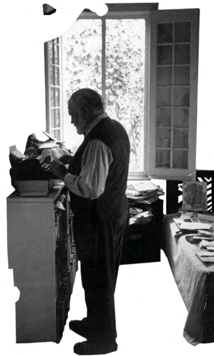
Figura 3.1: Anónimo, Hemingway at his standing desk (década de 1950)