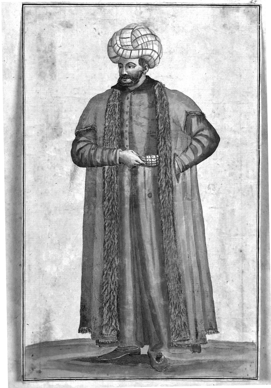
William Gell. Figura vestida a la turca (autorretrato). Acuarela.