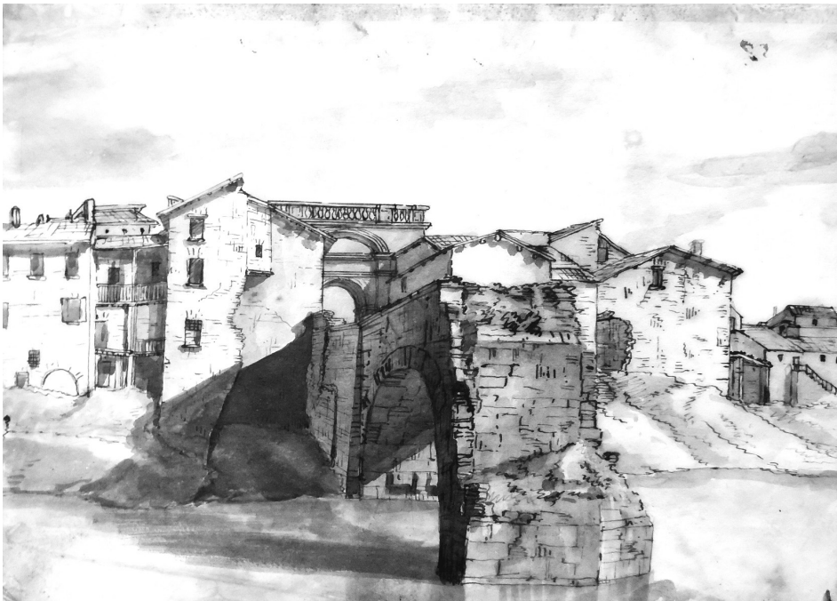
Romolo Liverani, Veduta del avanzo del ponte di Faenza