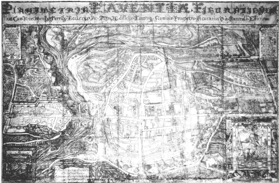
Virgilio Rondinini, Planimetria Faventiae , 1630