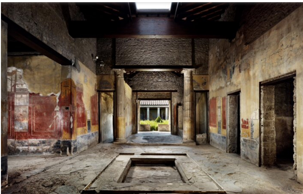
Figura 1: Atrio y peristilo de casa de Menandro, Pompeya

Unas veces surgían como prolongación de las galerías, otras como porches abiertos a ambos lados, en otros casos como recodos y soportales, e incluso algunas como pasillos lineales sin cubrir a modo de calles. Comienza una larga tradición de espacios, estancias y vacíos secundarios que permiten conectar y articular los atrios, patios y jardines generando gran diversidad de secuencias de espacios intermedios entre ellos.