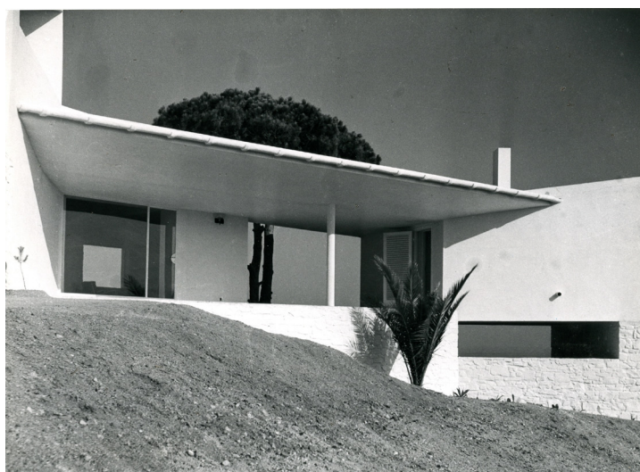
Figura 4: Jose Antonio Coderch, porche oeste de Casa Ugalde, Caldes d'Estrac, Barcelona, 1951

Es habitual que las explicaciones sobre esta casa comiencen mostrando el croquis de José Antonio Coderch sobre la posición de los árboles existentes y las posibilidades de las vistas que se contemplan desde cada ángulo del terreno existente. Después aparece un primer boceto de planta repleto de dudas e intenciones sobre cómo disponer la casa en ese croquis previo. Tras un trabajo arduo de dibujos a mano alzada, se traza una arquitectura orgánica adaptada al pinar y a la topografía escarpada. El resultado posterior que hoy conocemos es una obra maestra, una de los primeros proyectos de José Antonio Coderch. Ahora solo nos aproximaremos a conocer sus porches y rincones de pasos perdidos para identificar esos espacios donde fijar la atención. En una complicada fusión de vistas y secciones de plataformas a mitad de la ladera, la casa genera varias secuencias entrecruzadas de tránsitos claros y oscuros. El interés de este trabajo por aquellos otros espacios indeterminados, que emergen como tránsitos entre los espacios convencionales de la casa, lugares sin nombre, donde guarecerse del sol mediterráneo, cobijos de mediación que resuelven encuentros complejos. Lugares que elige nuestra intuición sensorial para mirar y compartir, detenerse o permanecer.