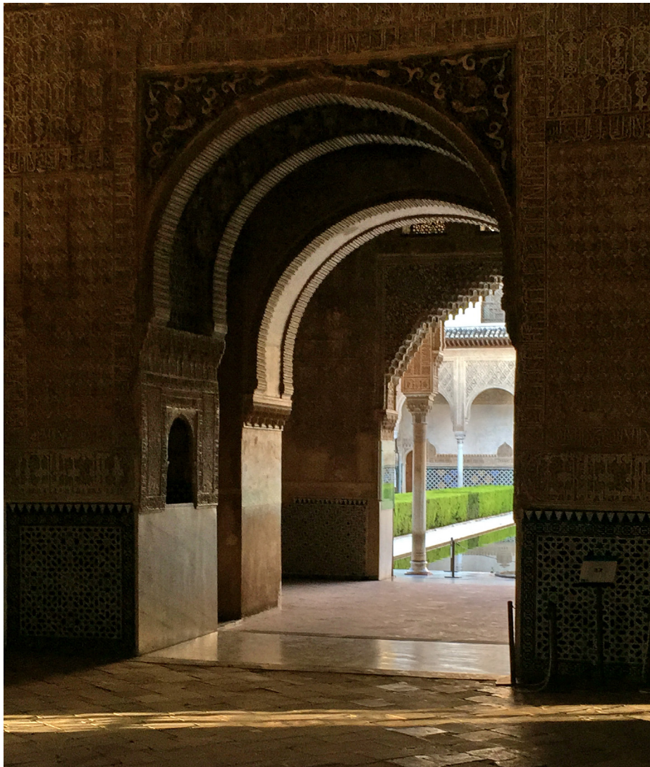
Figura 2: Secuencia de ingreso a la Qubba de Comares. Alhambra, Granada

Podemos comprobar de forma precisa estas secuencias en el acceso a la qubba 2 del palacio de Comares.