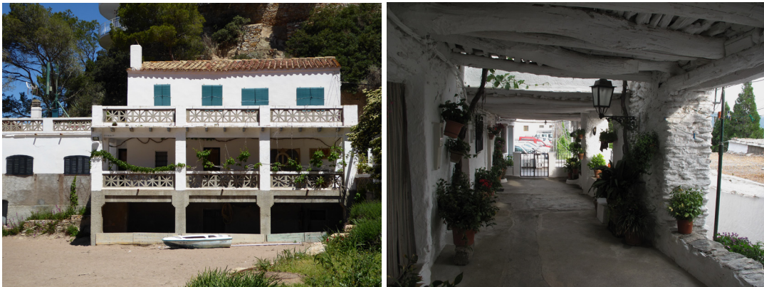
Figura 3.1: Casa Bastida, Begur, Gerona

Similares son los soportales que se descubren cuando se transita por las callejuelas de los pueblos de la Alpujarra granadina. Las casas se apoyan sobre las calles con habitaciones o cubiertas pasantes, produciendo bajo los mismos porches de entrada, terrazas o soportales de paso. Igual ocurre con los adarves y pequeños patios de labor, cuyo final o límite de encuentro con el campo agrícola se difumina en ese callejero confuso. La dificultad para dilucidar los límites entre lo público y lo privado fructifica en una amplia diversidad de espacios intermedios que prolongan la relación de la arquitectura con el entorno, más allá de las fachadas o de los patios. Estos tránsitos suponen un cambio de escala entre exterior e interior, entre sol y sombra, que enriquecen el espacio arquitectónico y urbano.