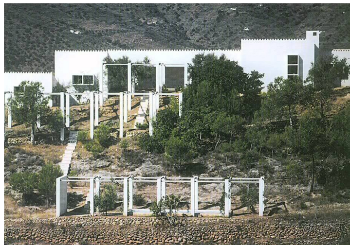
Figura 4: Bernard Rudofsky, Casa en Frigiliana, Málaga

Coetánea con Can Lis 6 es la casa que Bernard Rudofsky se construye en Frigiliana 7 , Málaga (1972). Casa que curiosamente le dibuja su amigo Coderch. Una interpretación distante de lo mediterráneo de la realizada en Can Lis, aunque se detectan rasgos coincidentes, como las ventanas abocinadas en serie, el despiece en cuerpos separados y los porches como elementos autónomos. La casa en Frigiliana está más adaptada a la topografía, -Utzon establece una plataforma de apoyo sobre el acantilado siguiendo sus propios principios-, sin embargo, Rudofsky se apoya en un sistema de paratas -muy común en las costas del Mediterráneo-, y plantea un tratamiento muy escenográfico de la piscina y su conexión con la casa mediante una pérgola descendente por la ladera. Un recorrido construido sólidamente como conexión entre paratas apergoladas de estancia.