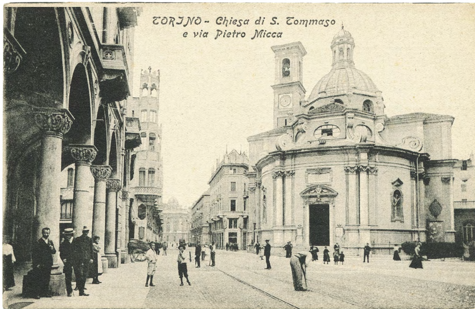
Figura 4: Tarjeta postal histórica que ilustra via Pietro Micca sobre palacio Madama, Turín, principio siglo XX

Las arquitecturas modernas, sin embargo, difieren de las más antiguas, más que por la imagen exterior, 15 «para ser recorridas en todas las direcciones por un laberinto de tuberías para la iluminación, calefacción, ventilación, el suministro de agua caliente y fría, la evacuación de las aguas domésticas y de lluvia, y la eliminación de las basuras de la vida orgánica» 16 . Las estructuras murales requieren una fundamental revisión de su conformación tanto por la multiplicación de las instalaciones en la casa como por la rápida transformación de la tipología de la vivienda. 17