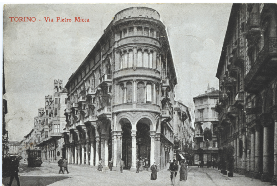
Figura 1: Tarjeta postal histórica que ilustra la entrada de piazza Castello desde via Pietro Micca a la izquierda, Turín, principio siglo XX

Esso fa sì che verso il centro della città si vadano disponendo gli uffici politici ed amministrativi, i circoli e i palazzi dei ricchi, i teatri, le chiese, i grandi alberghi, i magazzini di lusso; mentre le case delle famiglie meno agiate, le sedi delle aziende aventi grandi opifici e grandi magazzini, si dispongono verso la periferia. Ma, crescendo sempre di più la città, avviene che le classi ricche [...] trovandosi stipate nel centro, bramose di aria e di luce, desiderose di cingere le loro case d'un giardino, [...] cominciano ad emigrare dal centro verso la periferia. 6