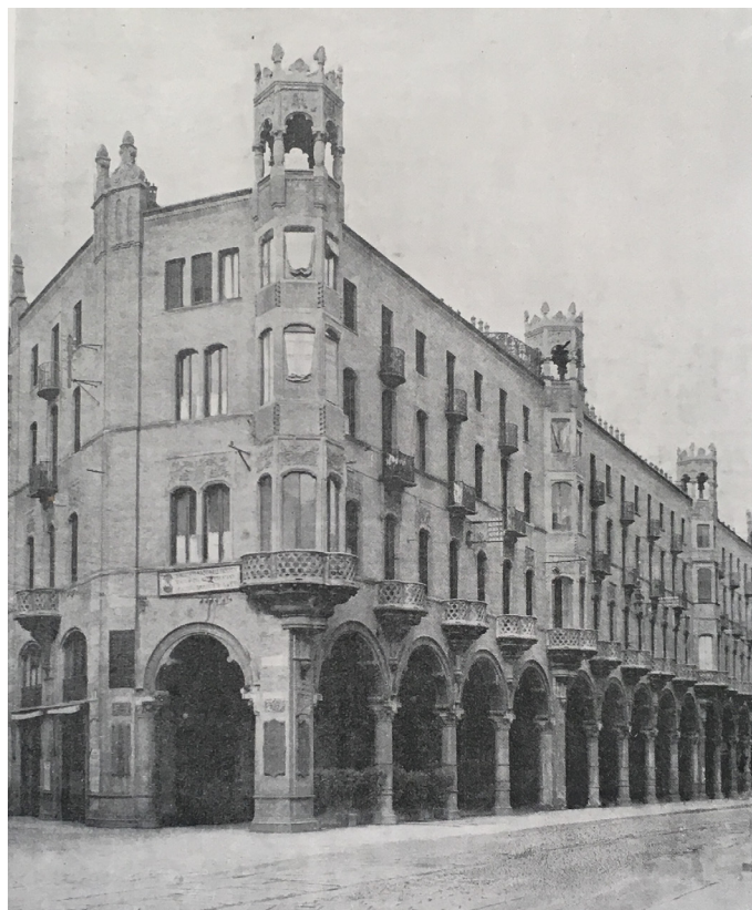
Figura 6: Fotografía de casa Bellia, Turín

al alquiler. El proceso de diseño, confiado a Carlo Ceppi 31 por la empresa de construcción Bellia, está influenciado fuertemente por factores de escala urbana, pero al mismo tiempo por factores arquitectónicos: la imposición de la diagonal sobre el lote, la reglamentación en materia de construcción en campo higiénico-sanitario y la introducción de las más modernas técnicas constructivas.