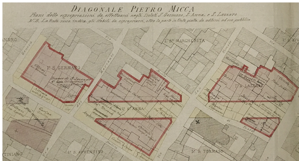
Figura 2: Diagonal Pietro Micca y plan de las expropiaciones, Turín, 1894

Le strade strette vengono allargate, e sulle rovine di case incomode e malsane sorgono eleganti palazzi (via Pietro Micca). Questi sventramenti [...] rendono meno accentuato il fenomeno di eccentricazione, potendo i ricchi avere belle e comode abitazioni anche nel centro della città. 9