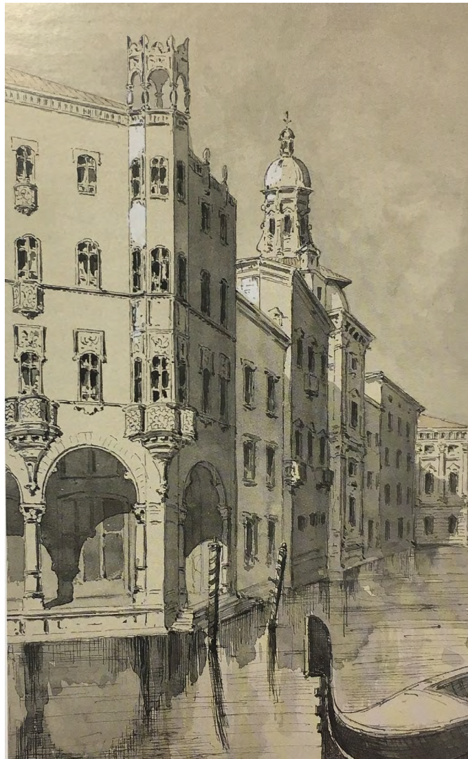
Figura 7: Carlo Ceppi, Dibujo en acuarela de Casa Bellia ambientada en Venecia, finales del siglo XIX

diferentes elementos compositivos, el porche, una estructura que distingue el escenario urbano de Turín, asume un papel fundamental estableciendo una continuidad de camino entre dos puntos cruciales de la ciudad: las estaciones de Porta Nuova y de Porta Susa. 33 Entre los diferentes porches turineses, los de casa Bellia gozan de una estructura portante de hormigón armado con el sistema Hennebique que permite aumentar la luz de los locales en la planta baja y, por lo tanto, del área acristalada de las tiendas. 34