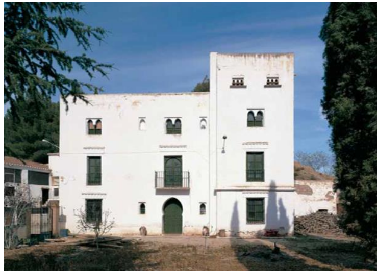
Figura 3: Señorío del Cortijo de la Veguilla en Guadix

Las casas de huertas se implantan en los valles fluviales destinados a explotaciones intensivas de regadío, en las inmediaciones de núcleos densamente poblados. De tamaño pequeño o medio, en muchos casos se asociaban a programas vivideros estacionales de sus propietarios diferenciados de las dependencias productivas, apareciendo en numerosas ocasiones vínculos evidentes con la arquitectura urbana, como los remates en forma de pabellones abiertos de las casas de huerta granadinas, recurrentes en la arquitectura doméstica del casco histórico capitalino, o en formalizaciones como el cortijo de la Veguilla en la Hoya de Guadix, cuyo señorío presenta reminiscencias del estilo proto-racionalista auspiciado por el Carmen de la Fundación Rodríguez Acosta en Granada.