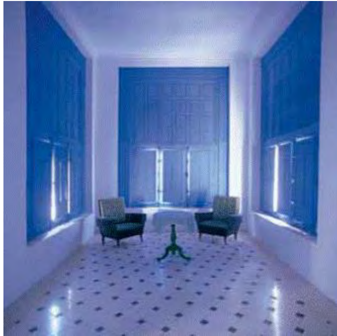
Figura 5: Estancia del señorío del Cortijo de Fatimullar en Agrón