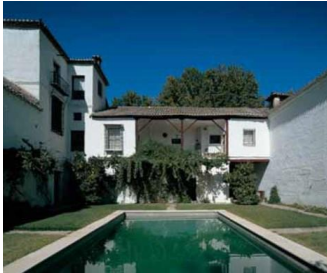
Figura 4: Solana del señorío del Cortijo de El Alitaje en Pinos Puento

Es en el caso de las fincas destinadas a policultivos bajo auspicios de órdenes religiosas próximas a cursos fluviales, donde los programas de las estancias vivideras alcanzan una mayor expresividad, como en la Hacienda Jesús del Valle en Granada, junto al río Darro, de fundación jesuita, o la Granja dn Baza, junto al del Guadiana Menor, erigida por los jerónimos. Organizan sus habitaciones principales en torno a un patio de cuidada traza, completado en el caso bastetano e inconcluso en el granadino.