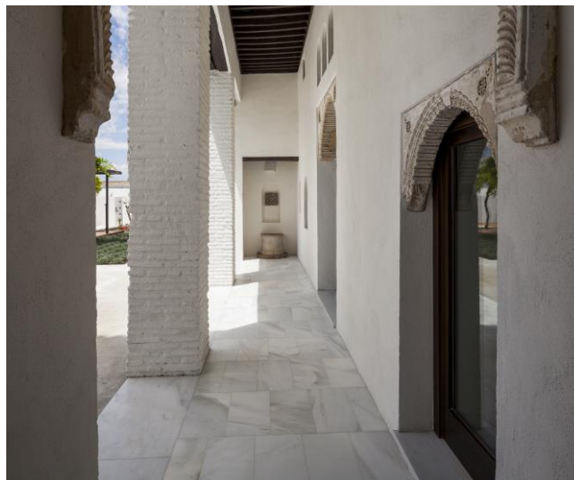
Figura 1: Galería porticada de la Casa de la Marquesa, antigua almunia de Darabenz, rehabilitada para uso hotelero por los arquitectos Soler y Martínez Manso

Se unen para la despreocupación por la formalización en las arquitecturas del campo granadino la menuda estructura de la propiedad de la tierra heredada de los repartimientos medievales que conllevaba construcciones de tamaño modesto, y la tradición de los propietarios castellanos tras la conquista cristiana de ubicar sus moradas en las ciudades y no en el campo. No obstante, pueden encontrarse referencias estilísticas centradas precisamente en las dependencias de habitación principal, ligadas a las propiedades de mayor poderío económico y formación intelectual, donde quedan expresadas las corrientes arquitectónicas y constructivas de la época.