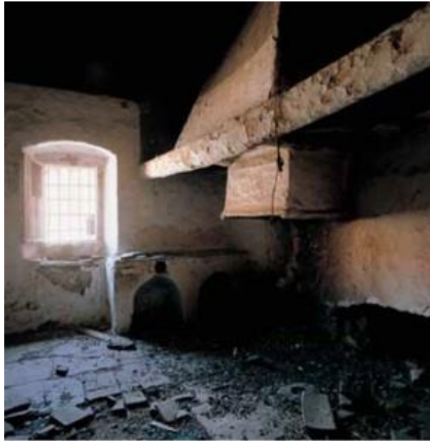
Figura 7: Cocinón con chimeneón en el Cortijo del Administrador de La Calahorra