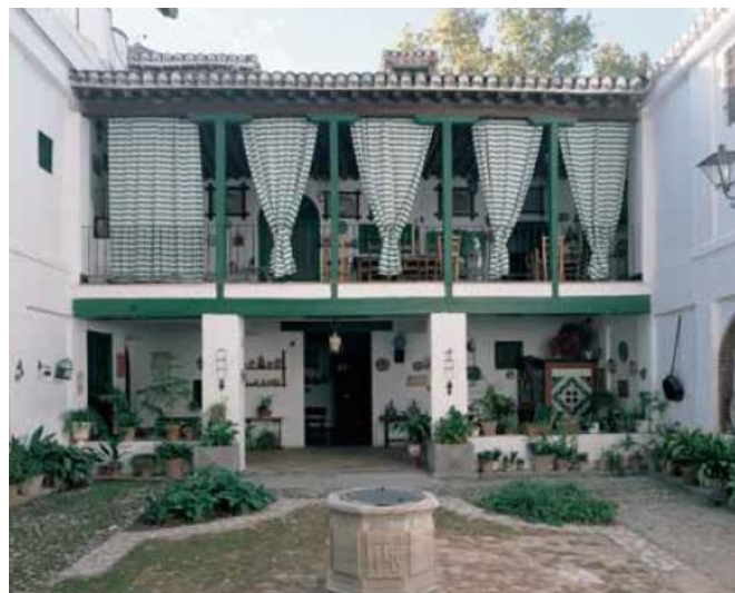
Figura 2: Galería del señorío de la Casa Muharra en La Zubia vinculada a patio interior

Los señoríos y casas de propietarios, en explotaciones de mediano y gran tamaño, se diferencian del resto de las estancias vivideras mediante su singularización, constituyendo en algunos casos inmuebles independientes del resto, incluso con condición de casa de solaz y recreo, como en la Casa Grande de Cázulas en Otívar, el Cortijo de Santa Ana en Pinos Puente, o la Casa Muharra en La Zubia, donde la formalización del señorío se nutre de referencias de modelos urbanos próximos asociándose a una zona de jardín diferenciada. Aparecen estancias destinadas a bibliotecas, salas de recepción y celebración o alcobas propias de dichos modelos.