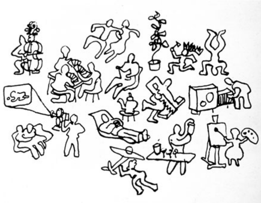
Figura 5: Charles Eames, What is a house , 1944

Johnson en New Canaan, Connecticut (1949). 17 A diferencia de esta última, la casa Eames muestra un aprendizaje real sobre el trabajo de Mies en su disposición de objetos en el paisaje, que se plasma, entre otros aspectos, en los reflejos del exterior en el interior.