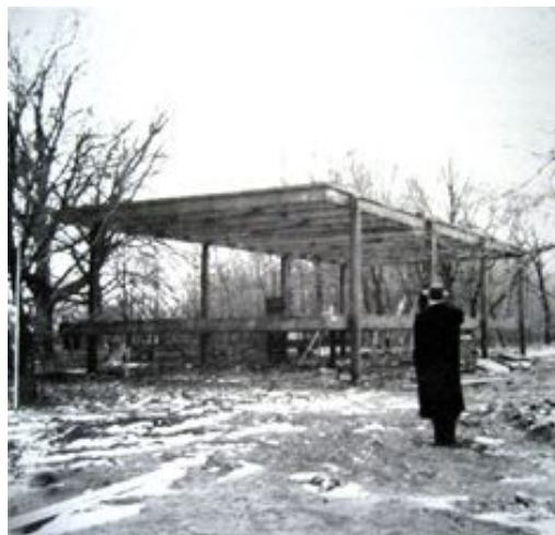
Figura 4: Mies van der Rohe en la casa Farnsworth, 1945-1951

Mies era consciente de que el río se desbordaba en primavera y se preocupó por obtener datos fiables sobre la cota de inundabilidad para situar la edificación protegida de las crecidas, lo cual determinó el diseño de la casa, no solo en sus niveles, sino en las soluciones estructurales y de cimentación adoptadas y hasta en su propia concepción formal, en sus proporciones perceptivas desde el exterior y en relación con el entorno. La ausencia de caminos en el interior de la finca y el estudio de axialidades en los escalones previos a las plataformas acentuaban el aislamiento de la casa, que quedaba exclusivamente en relación directa con la naturaleza, sin ningún otro elemento adicional más.