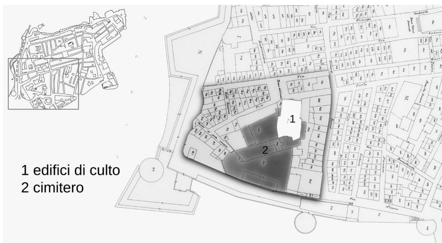
Particolare S-E nella Mappa della città di Algero 1876.

(Fonte: Archivio Storico Comune di Algero, Elaborazione grafica A. Vecciu)