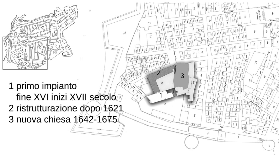
Particolare Complesso Ex Gesuitico nella Mappa della città di Algero 1876