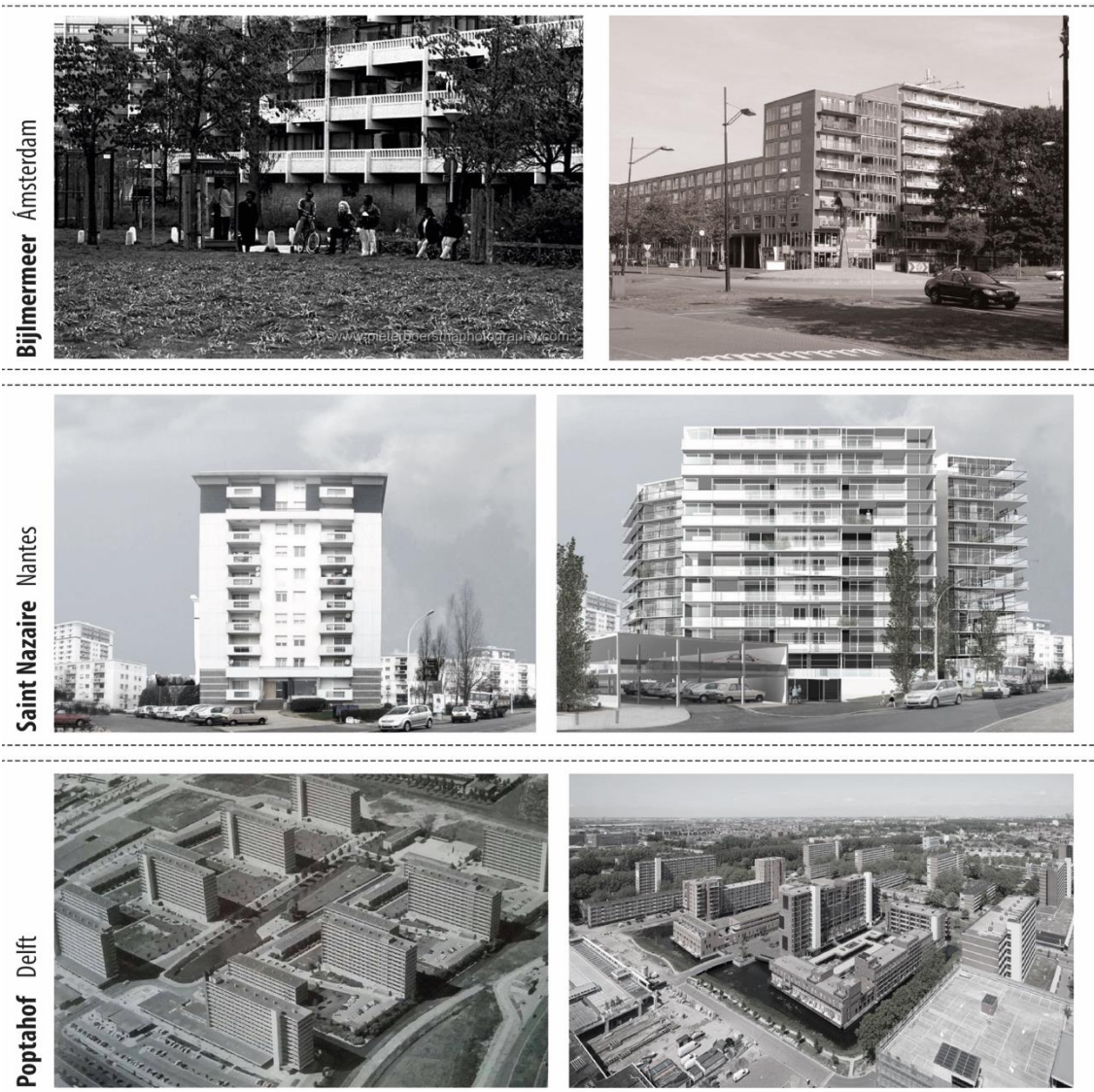
Figura 1: Algunos modelos europeos de regeneración urbana:

Figura 1.1: transformación radical, Bijlmermeer, Ámsterdam