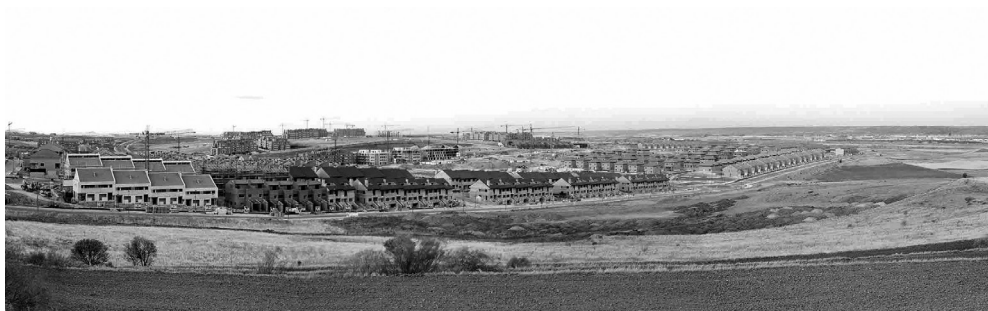
Rubén Lorenzo Montero y Pablo Rey Mazón (Basurama), Urbanización Miramadrid .