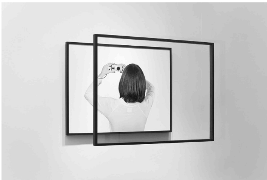
Almudena Lobera, Lugar Entre / Somewhere Between , Fotografía y vidrio enmarcado, 65 x 85 cm, 2012.

y skopein ‘mirar’. Sólo desde estos niveles y enfoques será posible comprender las lógicas e ilógicas que subyacen bajo las complejas transformaciones de nuestros territorios. De esta forma, el paisaje se convierte en una herramienta fundamental y extremadamente potente para la gestión e intervención en el territorio, como ha apuntado Florencio Zoido: « Que se le llame paisaje, espacio vivido, territorio o mundo exterior no supone un cambio semántico significativo, pero el término paisaje contiene en este momento algunas posibilidades propias que pueden servir al objetivo de recuperar la armonía perdida, por varias razones principales: su amplitud semántica cargada de potencialidades para el conocimiento y para la acción; su prestigio como noción estética, adquirido en su ya larga trayectoria artística, complementado por su desarrollo científico vinculable a un entendimiento funcional, sistémico y ético del espacio vivido y a su potencialidad para la ordenación del territorio como práctica pública » 19 .