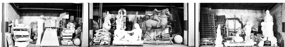
Almacén de monumentos del Ayuntamiento de Barcelona, marzo de 2014.

Nacional d'Art de Catalunya. Perejaume reúne un conjunto de obras de arte y objetos cotidianos colocados de forma que invitan a establecer relaciones como si hubiera un hilo conductor invisible a lo largo de todas ellas. Se trata de « emparejamientos de obras » que hacen posible « adivinar que cada obra influye en las de al lado pero también en las de detrás », con la intención de « hacer una raya, una línea continua, donde se establece un discurso (...) que permite el gran contagio entre las obras » 15 una transmisión de unas hacia otras. La Maniobra, esa línea de obras, es el catálogo. Lo que convierte una serie de objetos más o menos cotidianos y sin aparente valor guardados en un pequeño almacén, en una valiosa colección.