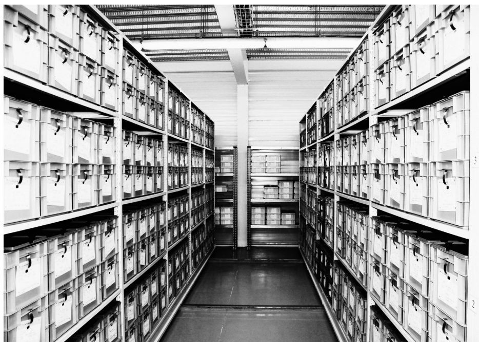
Archivo arqueológico, 2014.