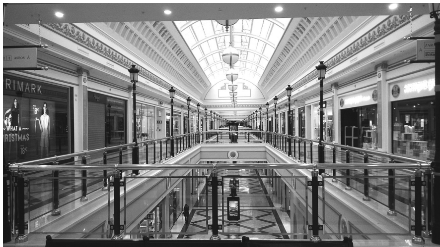
Centro comercial Madrid Gran Plaza II, 2015.