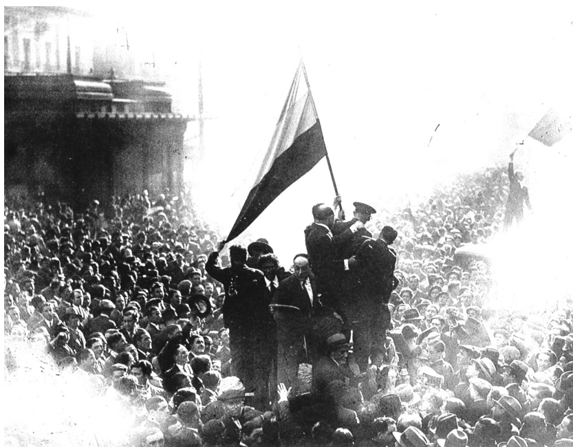
Puerta del Sol de Madrid: proclamación de la Segunda República el 14 de abril de 1931