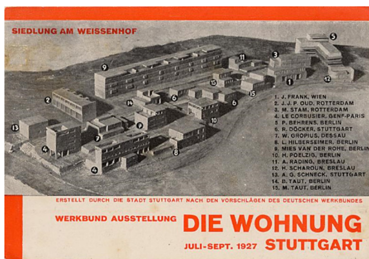
Figura 3: Willi Baumeister, cartel de la exposición Die Wohnung , 1927, Stuttgart

Por vez primera en la historia de la arquitectura el foco de la construcción, en el cual se puede identificar la voluntad colectiva de toda una época, no residía en construir para una élite, en un castillo, palacio o iglesia. Se trataba de construir para las masas y esto, por supuesto, requería de una nueva forma. 7