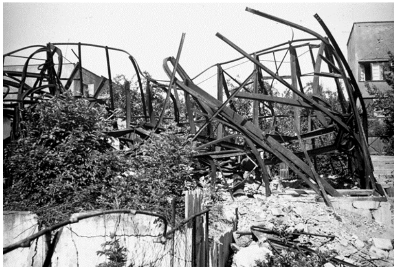
Figura 7: Ruinas de la casa de Walter Gropius tras el bombardeo de las fuerzas aliadas sobre la Weißenhof, 1944, Stuttgart

Ni Gog ni Mies se encontraban ya en suelo alemán: en 1934, el vagabundo había aprovechado un internamiento en el hospital para huir a Moscú, donde se casó de nuevo y comenzó a trabajar para la radio rusa. Cuando los nazis atacaron la Unión Soviética en junio de 1941, se desplazó a Uzbekistán hasta que fue deportado al campo de Kuznetsk (Siberia). En 1937, el arquitecto se había exiliado a EEUU y fue nombrado director de la Escuela de Arquitectura del Instituto de Tecnología de Illinois (Chicago). Allí recibió la noticia de la destrucción de una parte de la colonia de Stuttgart por un bombardeo de las fuerzas aliadas en 1944. Un año después, y tras un intento de suicidio, el rey de los vagabundos fallecía a los 54 años en un sanatorio de Tasmania.