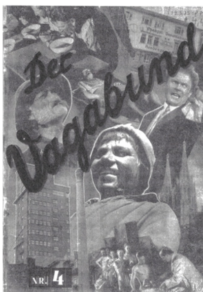
Figura 6: Cubierta de Der Vagabund , 1931

En 1930, el año en que Hans Richter estrenaba Die neue Wohnung , la película promocional de la Weißenhof, se presentaba Der Vagabund , un film del cineasta austriaco Fritz Weiss que mezclaba escenas reales y ficticias de la vida de los nómadas a partir del relato de un periodista que investiga la muerte de un vagabundo en la calle. La colaboración de Gog como asesor y actor en la película provocó la primera crisis en la Hermandad y la interrupción temporal de la revista: eran los primeros síntomas de una fractura que llevó al rey de los vagabundos a viajar hasta la Unión Soviética, donde cambió su visión crítica del comunismo hasta entrar en conflicto con sus antiguos compañeros, a los que despreciaría por pequeño-burgueses. 20 La conversión también trajo cambios en la publicación, que, en 1931, pasó a denominarse Der Vagabond , y en la modernización de su imagen de portada, adoptando la estética del fotomontaje soviético.