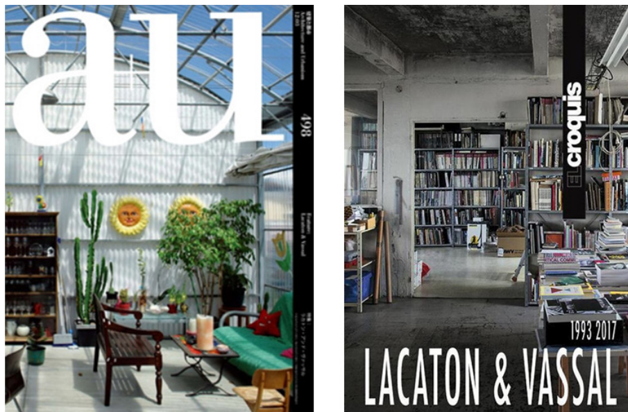
Figura 7: Portadas de A+U, n.º 498, y El Croquis , n.º 177-178, dedicados a Lacaton&Vassal

Bourriaud fue fundador del Palais de Tokyo de Paris, para el que convocó el concurso para la transformación del edificio en 1999 y del que resultaron ganadores los arquitectos Lacaton & Vassal. La relación de los arquitectos con el crítico y su trabajo juntos quizás influyó en la comprensión de la arquitectura, cuyo trabajo sobre el edificio preexistente no destaca por su arquitectura que se limita a dotar de un mínimo equipamiento, sino por la estrategia de gestión de la inversión y los plazos de obra para facilitar el arranque y funcionamiento de proyecto. 21 No en vano el proyecto presenta una estética informal que condiciona al público, liberándolo de la impostura educada, correcta y elegante al que fuerza la “caja blanca” arquetípica del museo, liberando de las jerarquías compositivas contruidas por el panoptismo de la composición arquitectónica y con una materialidad que no sugestióna hacia una actitud impostada.