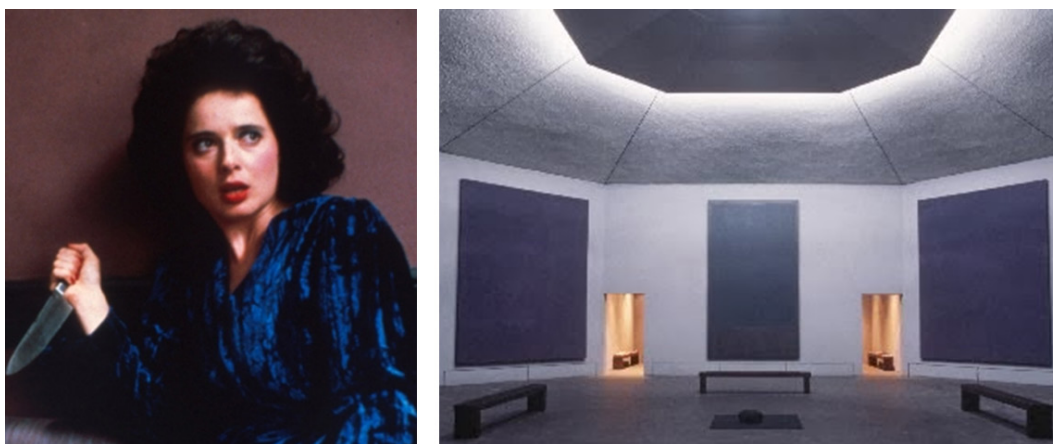
Figura 2: David Lynch, Blue Velvet, 1989; Mark Rothko, Houston Chapell, 1968-69

película, donde se concentran las oscura perversiones del personaje de Dorothy y que el personaje de Jeffrey (Kyle MacLachlan) interpreta desde un conflicto entre lo maternal y lo sexual. Esta forma de entender la relación entre los personajes puede superponerse con la idea del título de la película, "Terciopelo Azul", en el que el autor deja patente la importancia simbólica que el terciopelo juega en Lynch, ya que representa el material vivo, la piel. Y junto al terciopelo el azul, un color muy usado por el director como símbolo de la frontera entre mundos o como entrada en la oscuridad. De nuevo la capacidad simbólica del la materia, ya que el azul es usado comúnmente en el arte para reforzar la oscuridad del negro, como demuestran las exploraciones de esta combinación la obra de Mark Rothko, uno de los autores con mayor influencia en la obra de Lynch. 7 Lynch usará el azul como lugar de conexión en los destellos demenciales de Carretera Perdida o en las enigmáticas cajas y llaves azules de Mulholland Drive , que conectan los dos mundos de la historia. En esta película el azul cubre la piel de Dorothy, en ocasiones como una luz proyectada mientras actúa en el Slow Club , en otras cubriendo su cuerpo como una fina capa a modo de batín, incluso como maquillaje sobre la piel de sus parpados, un azul que muestra la oscuridad que acontece bajo su piel.