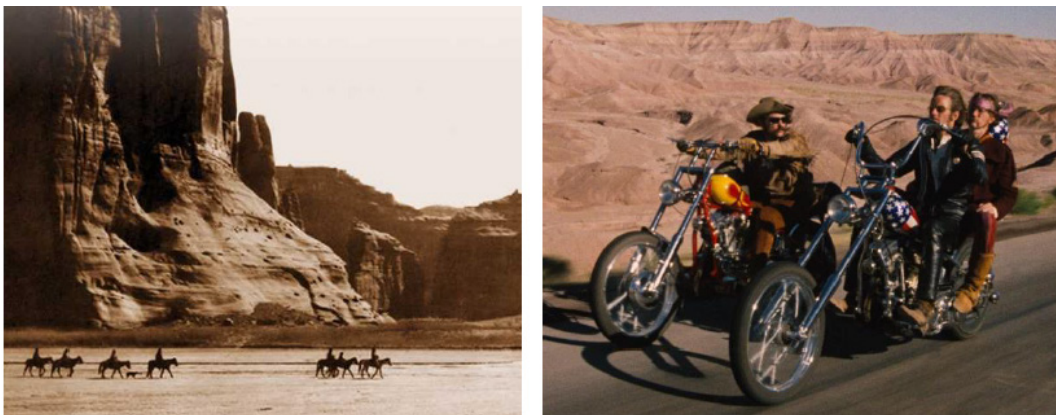
Figura 1: Edward Sheriff Curtis, Cañón de Chelly , 1904; Dennis Hopper, Easy Rider , 1969

Estados Unidos es un caso paradigmático de las formas en que la imagen funciona en la construcción del “subconsciente colectivo”. 1 El país que nacía a finales del S.XVIII veía como la nación crecía hacia el continente de forma paralela al desarrollo y avance de la técnica fotográfica, en el que los primeros pioneros retrataron a las personas, caracteres, enemigos y paisajes que configuraban la “conquista del oeste”. Las imágenes de autores como Edward Sheriff Curtis o Timothy O’Sullivan en la narración de los paisajes del sur y el medio oeste de Norteamérica dieron forma a un imaginario que más tarde cristalizarían autores como John Ford, Howard Hawks, Sam Peckinpah o Sergio Leone, creando una idea del paisaje, la justicia o la masculinidad de los Estados Unidos modernos. Esta visión será actualizada en los tiempos de la decadencia del ideario tras la Guerra de Vietnam con la continuidad deformada de esta perspectiva de “hombre que vive bajo su propio código” 2 con el personaje arquetípico del “Easy Rider”, la visión de un paisaje saturado de la fotografía Adam Bartos o Robert Shore, la decadencia del modelo urbano en Edward Ruscha o la pérdida de la identidad del territorio en Robert Adams. 3 En toda esta narrativa, se cristaliza la historia mediante imágenes que han construido la identidad y el “subconsciente colectivo” a través de una narración nacional.