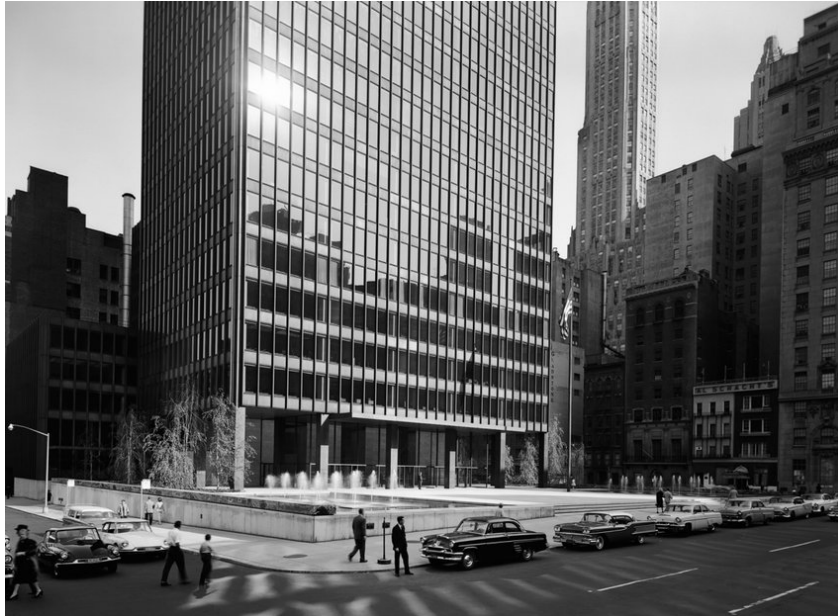
Figura 4. Ezra Stoller, New York Seagram Building , Nueva York, 1958

que mira con asombro la radiante arquitectura de Mies, que ilumina las zonas en sombra de una calle escasamente ocupada por coches ordenados junto a la acera y peatones que van a trabajar por espaciosos espacios públicos en una hermosa mañana.