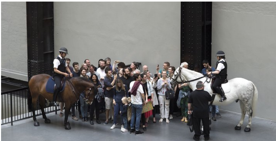
Figura 6: Tania Bruguera, Tatlin's Whisper # 5 . Tate Modern, Londres, 2008

No es de extrañar, ya que la arquitectura es según Kazys Varnelis, 19 la única disciplina artística que no se ha puesto en crisis a sí misma, o al menos no lo ha hecho con éxito. Y es que mientras la arquitectura respondía con la modernidad a la aparición de la fotografía en la construcción del imaginario colectivo, el arte lo hacía mediante un puesta en crisis del objeto artístico con Duchamp, primero mediante Desnudo Bajando una Escalera en 1912 y su interrelación con las técnicas cinematográficas y finalmente con la gran puesta en crisis del objeto con La Fuente de 1917.