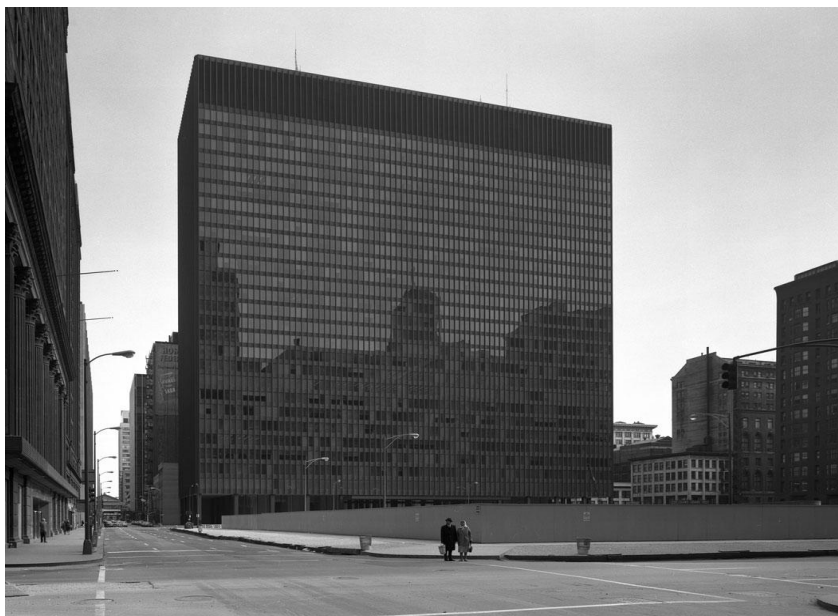
Figura 5: Richard Nickel, Chicago Federal Center , Chicago, 1956

Por otro lado la mirada de Nickel sobre el Chicago Federal Center presenta una ciudad sombría y un edificio hermoso pero oscuro y rotundo, insertándose en un entorno que parece desolado, decadente, donde una pareja da la espalda al edificio protagonista esperado para cruzar una calle por la que nadie circula, casi como en un cuadro de Edward Hopper.