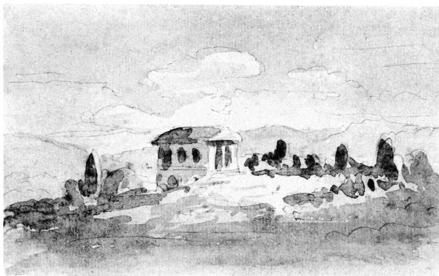
Johann W. Goethe, Park und Römisches Haus in Weimar, 1794