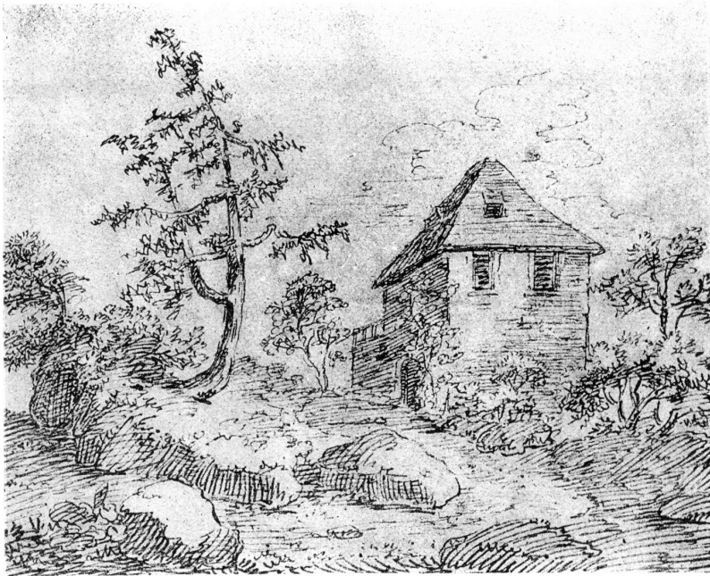
Johann W. Goethe, Goethes Gartenhaus in Weimar, fecha desconocida

Goethe manifestó un doble interés por la naturaleza que fue evolucionando en estudios paralelos: la botánica y el paisajismo. Cada uno de ellos le orientó hacia un tipo distinto de aproximación: el trabajo científico y la manifestación artística. Pero ambos se cruzan en el arte de la jardinería, haciéndose eco de la interpretación de Kant como metáfora literal de la naturaleza, como el «bello arreglo de sus productos», equiparándola, así, a la pintura 25 . Bajo su responsabilidad el parque del Ilm en Weimar fue un laboratorio donde Goethe pudo experimentar sus ideas introduciendo, de alguna manera, la naturaleza y el paisaje en la ciudad. Y es a través de los dibujos paisajistas de sus distintos componentes, hechos a lo largo de décadas, como podemos rastrear la evolución de sus ideas sobre el arte de la jardinería.