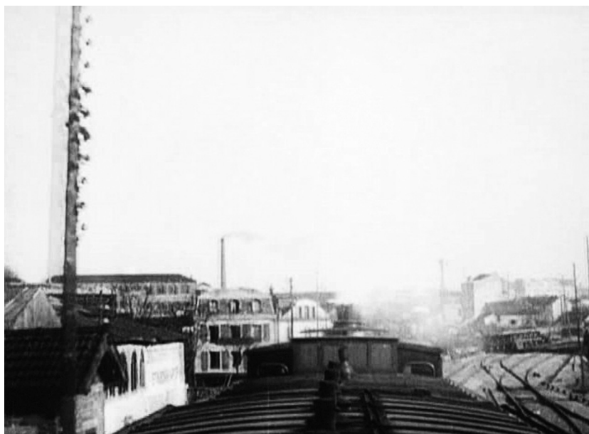
Georges Méliès, Panorama pris d'un train en marche , Star Film 151, 1898