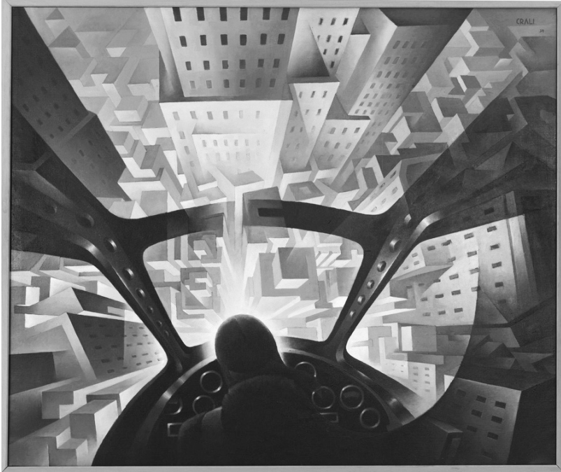
Tullio Crali, In tuffo sulla città , 1939