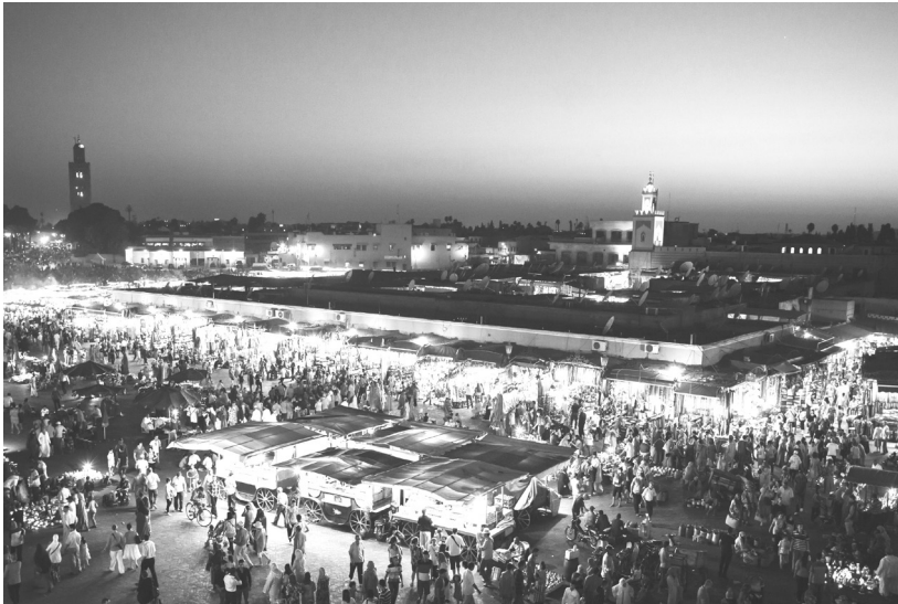
La plaza Jemaa el Fna - Aicha 1, Marrakech, Marruecos, 2013.