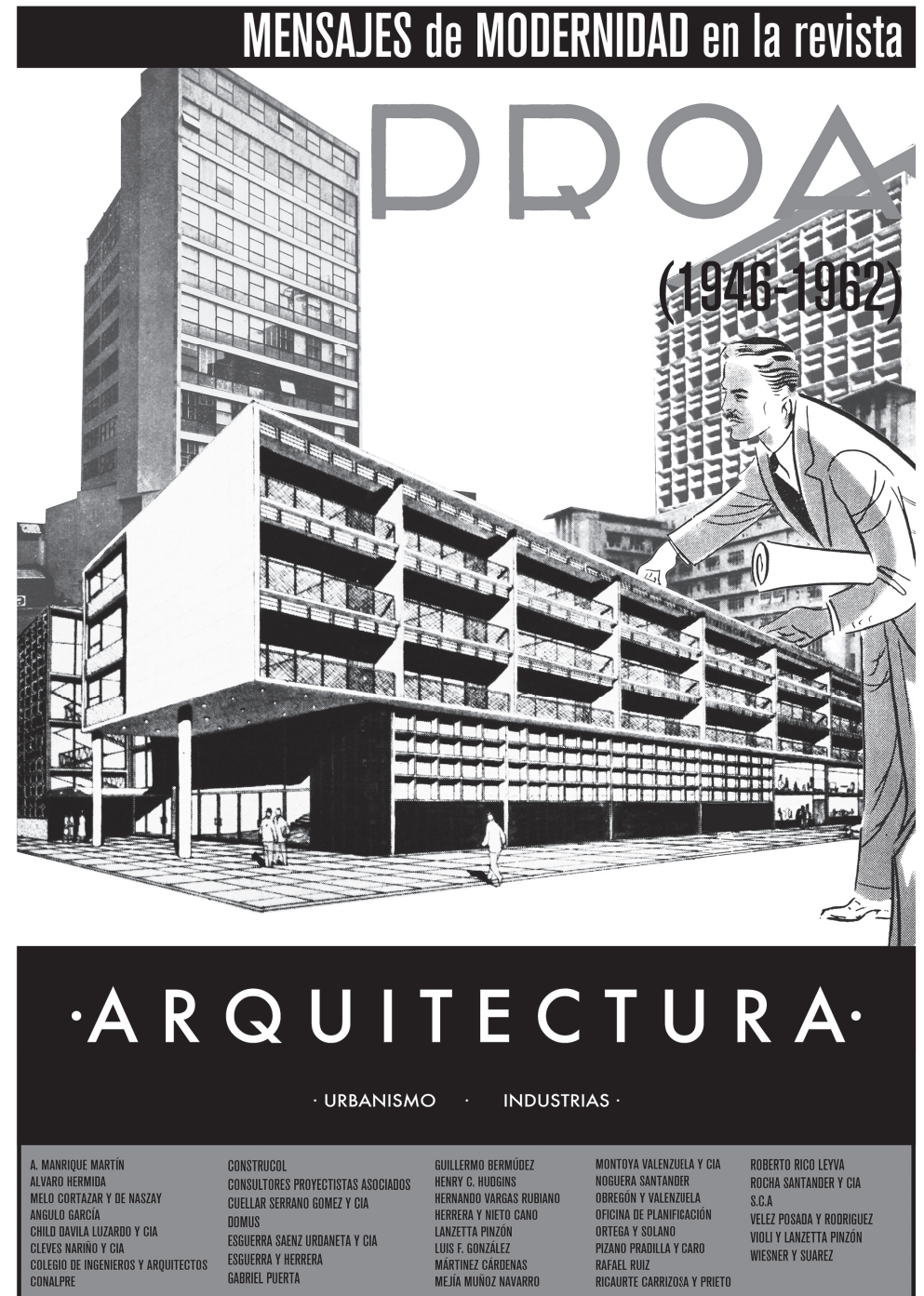
Fig 2. Imagen resumen de publicidades de arquitectos en revista Proa, Colombia, 1946-1962.