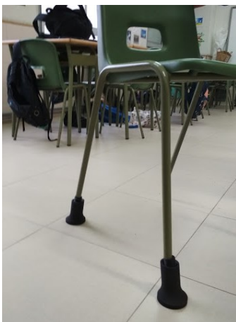
Figura 2. Silla con pieza realizada por impresión 3D

la posibilidad de utilizar mobiliario ajustable y regulable a cada estudiante (Kahya, 2019). Una vez hechas estas recomendaciones, los autores indican también que estas soluciones por lo general no serían viables por el coste que generaría a las Universidades. Debido a esta problemática, como segundo objetivo de la intervención nos propusimos buscar una solución creando un sistema que permitiera crear un mobiliario ajustable a partir del existente, pero que fuera de bajo coste. Para ello aplicamos la tecnología de impresión 3D, creando unas piezas como las mostradas en la figura 2. Las cuales se ajustan a las patas de la silla y permitirían adaptar la altura de la misma a las medidas antropométricas del alumnado. Con unas propiedades de material y diseño que garantizan la utilización de la silla en condiciones de seguridad y adaptación ergonómica.