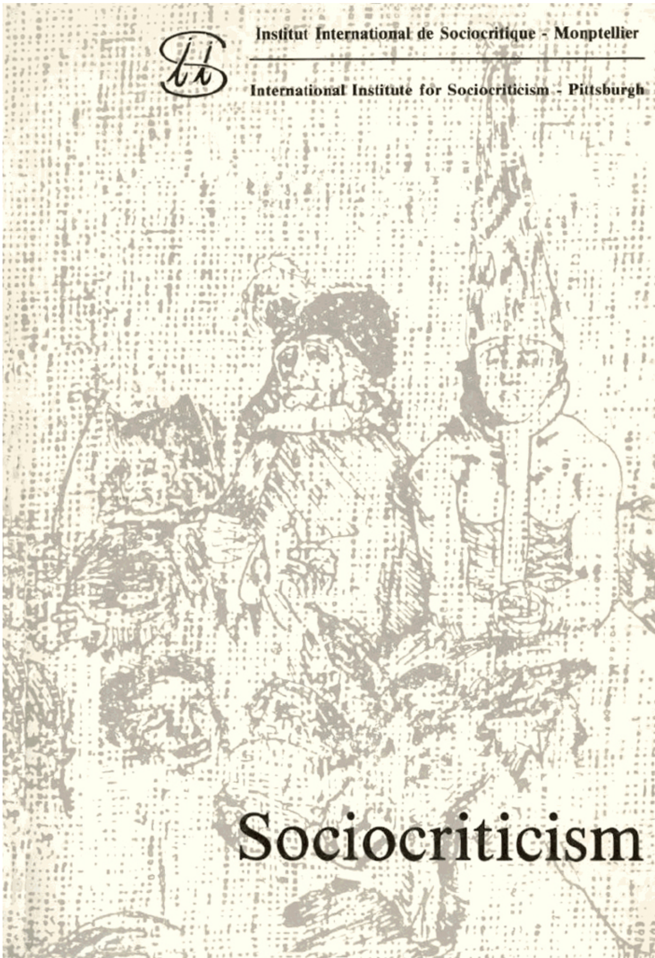
Ilustración 2:cubierta del volumen X, 1 y 2, de Sociocriticism (1994)