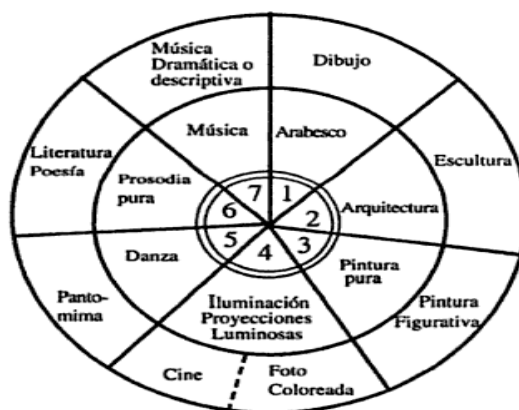
Figura 1. Correspondencias de las artes (Souriau, 1998, p. 122)

Pese a gozar de fama en las investigaciones interartísticas, dicha propuesta no está exenta de problemas según los teóricos. En esta línea, resulta de gran interés por el entramado metadiscursivo que presenta el sistema alternativo de intersecciones planteado por Victoria Llort (2011, pp. 91-101) en La memoria de las musas . Mientras que el esquema de Souriau aleja a las artes de su centro de gravedad, al avanzar por cada círculo en un movimiento centrífugo, el sistema de Llort procura reunir las, según ella misma afirma. Se nos ofrece aquí una nueva e interesante vía de estudio interdisciplinar, que da cuenta de los procesos transartísticos y prepara metodológicamente un significativo acercamiento a las fases de comprensión e interpretación artística.