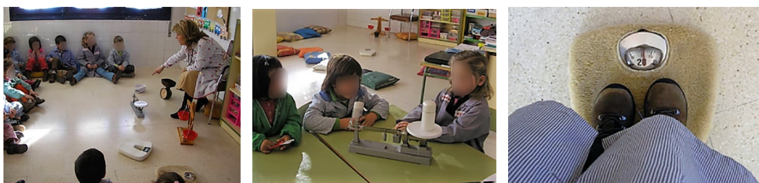
Figura 2. Descubrimiento de las características y funciones de distintas balanzas a través de la experimentación y el diálogo

De las imágenes de la figura 2 se desprende que el trabajo sistemático de la comunicación en el aula de Matemáticas de cualquier nivel educativo requiere integrar los procesos de interacción, diálogo y negociación alrededor de los contenidos matemáticos y su gestión, puesto que los alumnos a menudo interpretan las normas establecidas de maneras diferentes, y muy a menudo también estas interpretaciones difieren de las que los maestros esperan. En estos procesos de interacción, diálogo y negociación en el aula de Matemáticas, como señala Alsina (2016), las preguntas se erigen como uno de los instrumentos de mediación más idóneos, justamente porque pueden hacer avanzar desde unos primeros niveles de concienciación sobre lo que uno ya sabe o es capaz de hacer hacia niveles más superiores en los cuales va entendiendo la manera como puede avanzar mejor en el aprendizaje (Mercer, 2001).