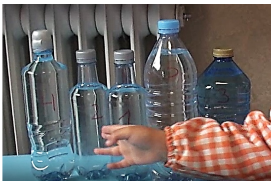
Figura 4. Ordenación inicial de las 5 botellas