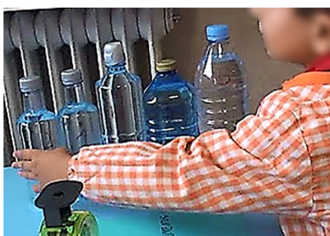
Figura 7. Ordenación final de las cinco botellas

A través de las preguntas que le va formulando la maestra, Santi modifica su ordenación inicial y finalmente logra hacer una ordenación casi correcta, de la que pesa más a la que pesa menos (cinco: 1014 g; tres: 1013 g; cuatro: 796 g; uno: 500 g; dos: 500 g)