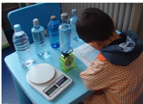
Figura 3. Diseño de la experiencia (cinco botellas, dos balanzas y la hoja de registro)

De acuerdo con este planteamiento, la maestra diseña un entorno de trabajo individual en el nivel situacional, en el que el conocimiento de la situación y las estrategias es utilizado en el contexto de la situación misma apoyándose en los conocimientos informales, el sentido común y la propia experiencia. En concreto, el diseño de la práctica se basa en presentar a cada niño el siguiente material: cinco botellas de agua de distinta capacidad, numeradas del uno al cinco (uno: 500 g; dos: 500 g; tres: 1013 g; cuatro: 796 g, cinco: 1014 g), dos balanzas (una balanza de agujas con un plato superior y una balanza digital), y una hoja de papel en la que deben registrarse por escrito los resultados de las mediciones (figura 3).