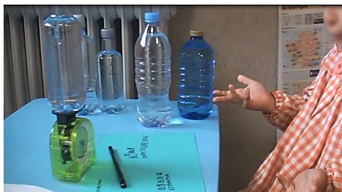
Figura 6. Nueva comprobación de la masa con la balanza de agujas

Santi: Sólo veo, sólo veo quinientos gramos.