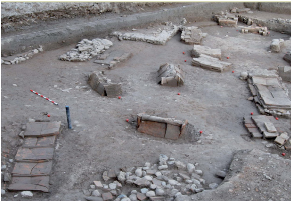
Fig. 9. Necrópolis S.III-IV de la Plaza Albert Einstein de Granada.