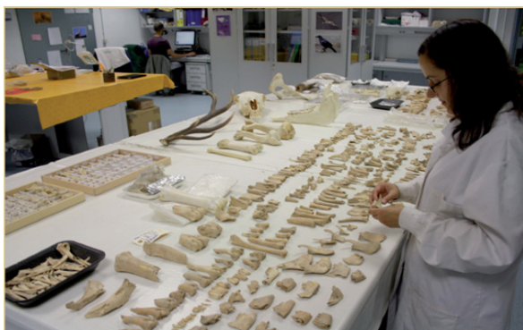
Fig. 4. Clasificación material arqueológico.

Elena NAVAS GUERRERO / Maria Isabel MANCILLA CABELLO