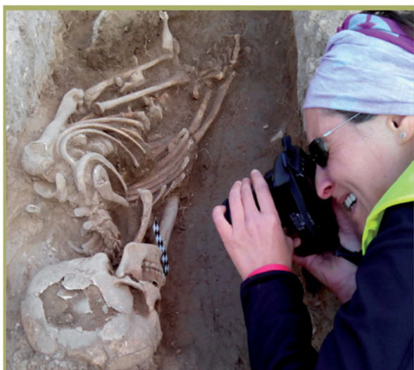
Fig. 1. Fotografía de una tumba.

Las personas que trabajan en arqueología son arqueólogos o arqueólogas, y para llegar a serlo, han tenido que estudiar una carrera universitaria y practicar mucho. Es un trabajo de gran especialización, en el que intervienen otras ciencias, de manera que los especialistas son capaces de conseguir información de prácticamente cualquier elemento que se haya conservado del pasado, como por ejemplo, el polen, los animales y plantas, la cerámica, etc. Durante las interven-