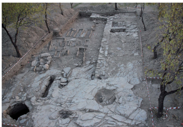
Fig. 6. Yacimiento arqueológico Pago del Jarafí, Lanteira (Granada).

Elena NAVAS GUERRERO / Maria Isabel MANCILLA CABELLO