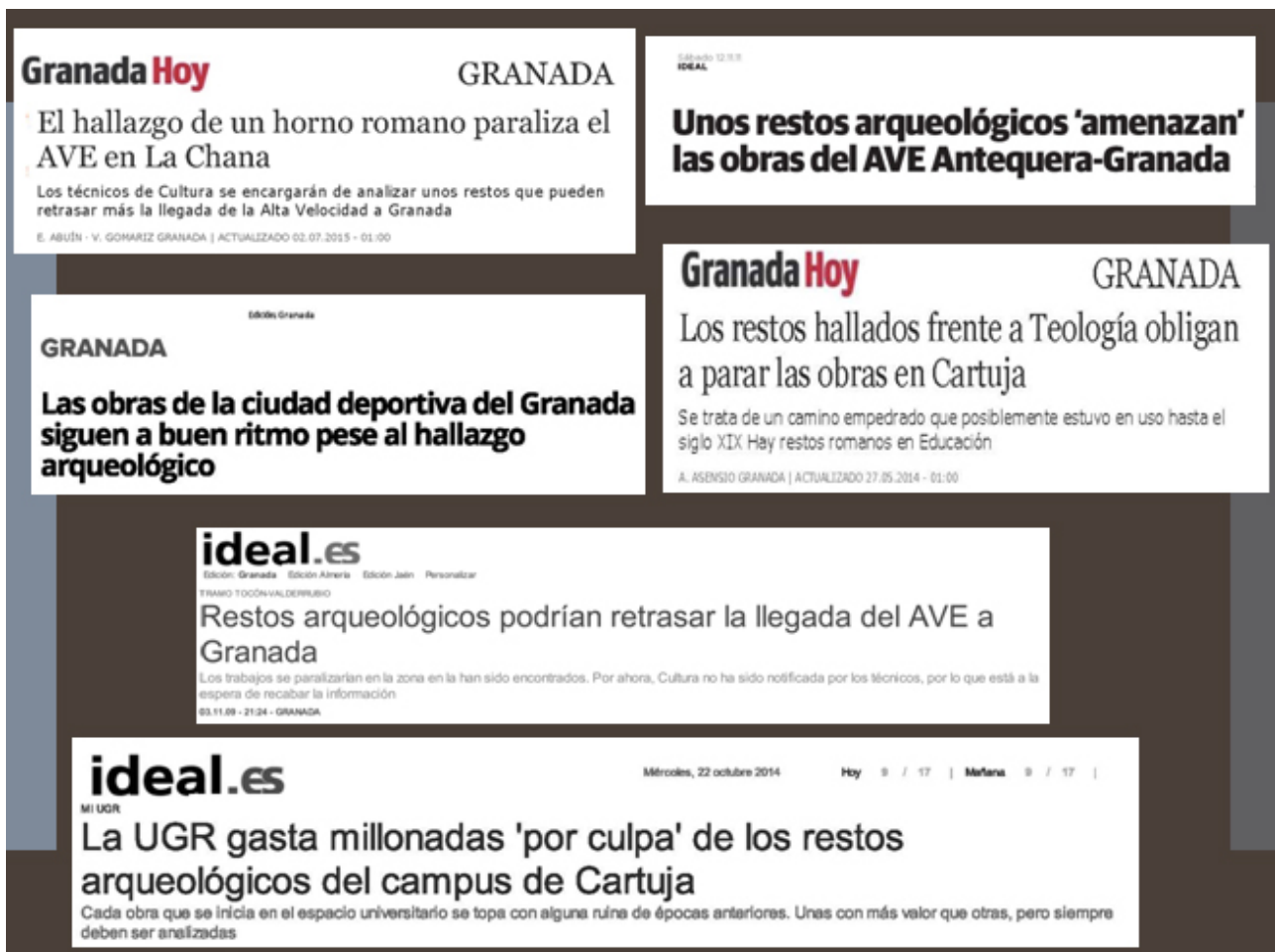
Fig. 10. Titulares periódicos. Cabello Mancilla, M.I.

La arqueología despierta el interés de la ciudadanía desde la misma metodología de trabajo, y sin necesidad de resultados aparatosos, existe una atracción enorme por el día a día de una intervención arqueológica. Hay que aprovechar esta curiosidad para llegar hasta la ciudadanía y mostrar la importancia que tienen "las cuatro piedras", y hacerla participe de nuestro pasado.