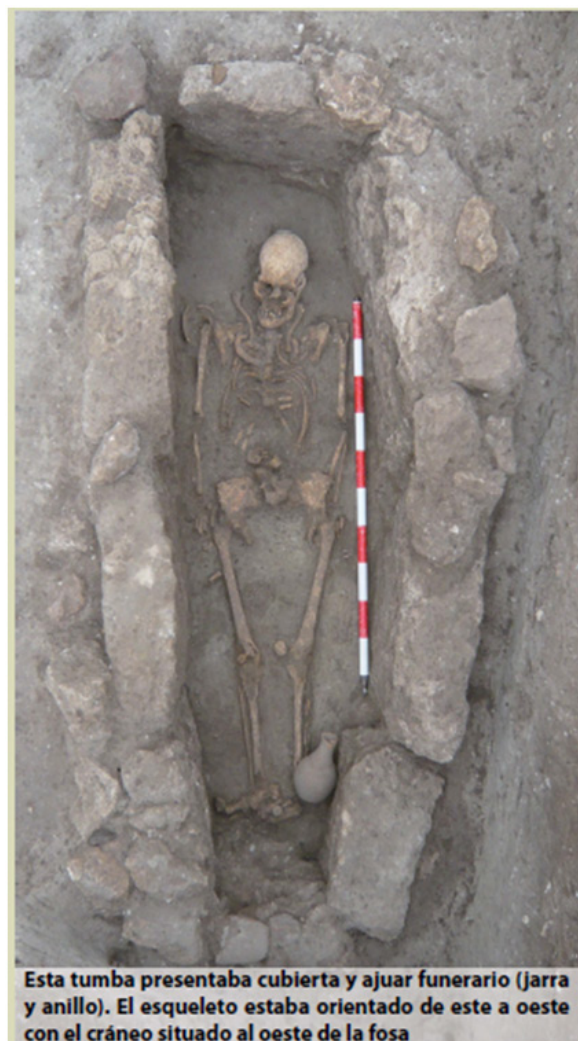
Fig. 7. Yacimiento arqueológico en Loja, obras de la carretera provincial GR-4407.