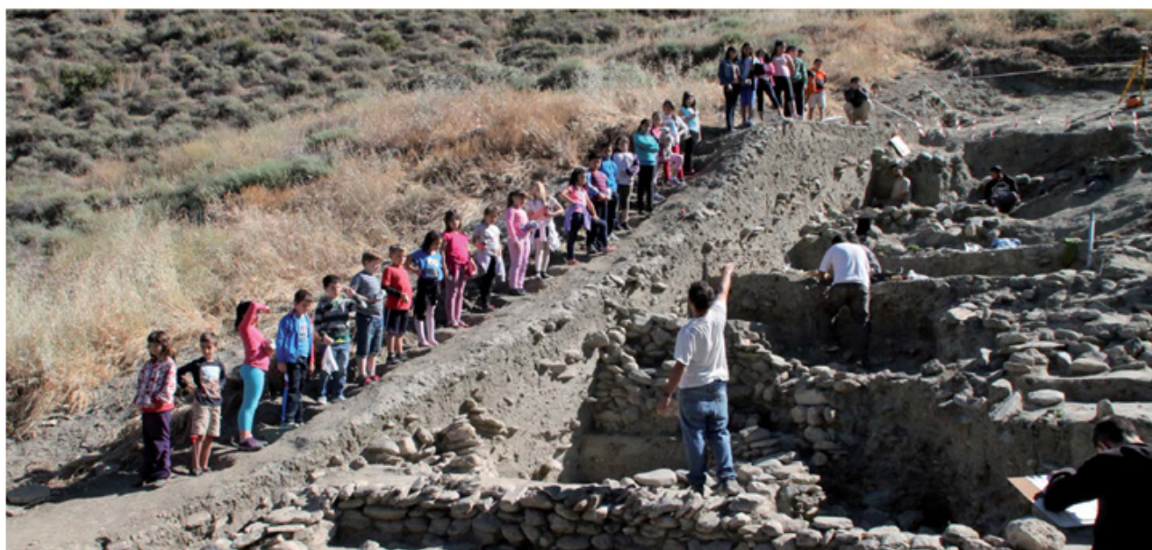
Fig. 5. Visita escolar a un yacimiento arqueológico.

Algunos hallazgos arqueológicos son muy sorprendentes, estos son solo algunos ejemplos de qué podemos encontrar bajo nuestras casas, calles y plazas.