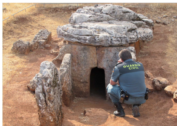
Fig. 2. Labores de vigilancia en el yacimiento arqueológico Peña de los Gitanos Montefrío (Granada).

ciones arqueológicas se recogen todos los datos posibles, mediante la aplicación de una metodología de trabajo muy específica, para estudiarlos y obtener conocimiento del pasado.