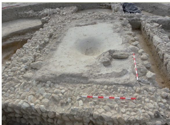
Fig. 8. Depósito para producción de aceite en El Tesorillo de Escóznar (Granada).