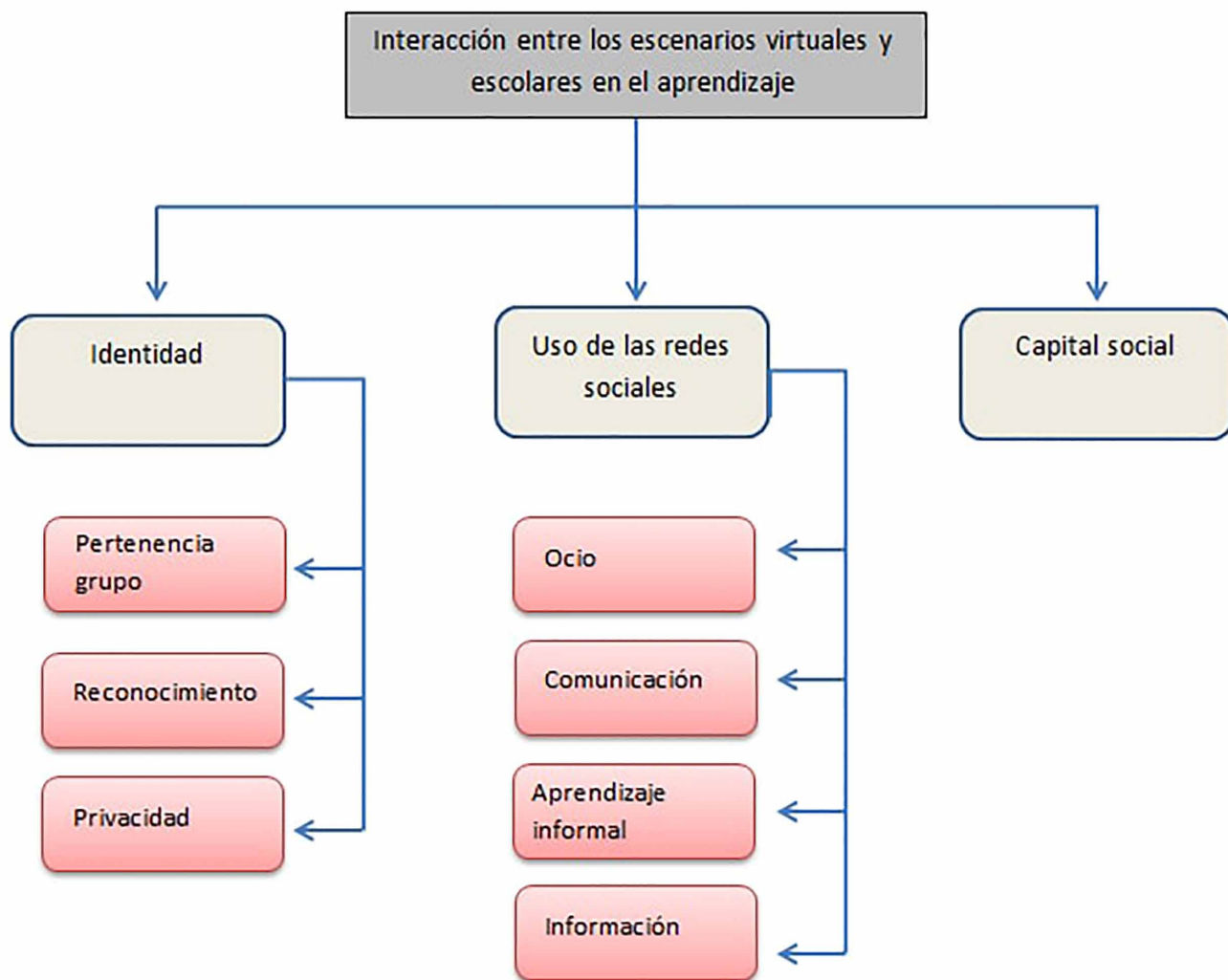
Imagen 3. Categorías definitivas.

En segundo lugar, definiremos las subcategorías de la macrocategoría identidad . Esta categoría hace referencia a la cultura internalizada