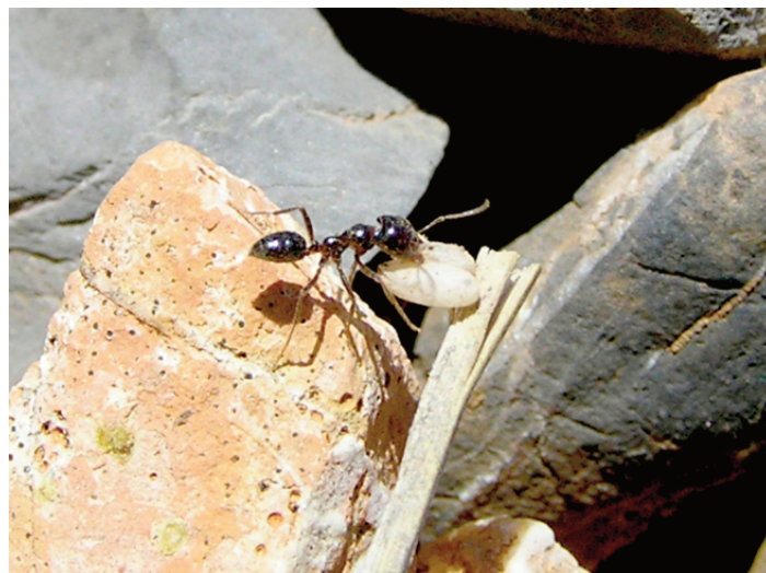
Figura 1. Obrera de R. minuchae transportando dos pupas de la hospedadora P. longiseta al hormiguero mixto parásito tras un asalto (Autor: J.M. Vidal Cordero).

Los parásitos sociales suelen ser filogenéticamente próximos a sus hospedadores, lo que les conduce a tener tasas similares de mutación y migración, así como tamaños poblacionales y potencial evolutivo comparables (Pennings et al. 2011). No obstante, estudios recientes en los que se compara la genética poblacional de parásitos sociales y sus hospedadores, obtuvieron resultados contradictorios, mostrando desde la ausencia de diferencias en diversidad genética o estructuración poblacional entre hospedadores y parásitos, lo que se interpretaría como un potencial evolutivo similar en estas parejas (Hoffmann et al. 2008; Foitzik et al. 2009; Pennings