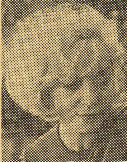
GARMEN DE LIRIO (Asunción)

ROSA: La chica del pueblo mal considerada por la "buena opinión" del lugar vive con D. Edelmito que la ha acogido sin pedir nada, a cambio, Rosa, en el pueblo se ahoga y ve en la Compañía de revistas su liberación. Juan, un muchacho del pueblo, la quiere, pero no es valiente para atreverse a hacer frente a las maledicencias de la gente del pueblo, y marcharse con ella a la ciudad.