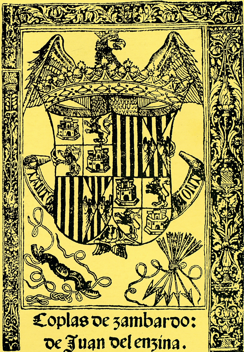
Escoplas de zambardo: de Juan del enzina.