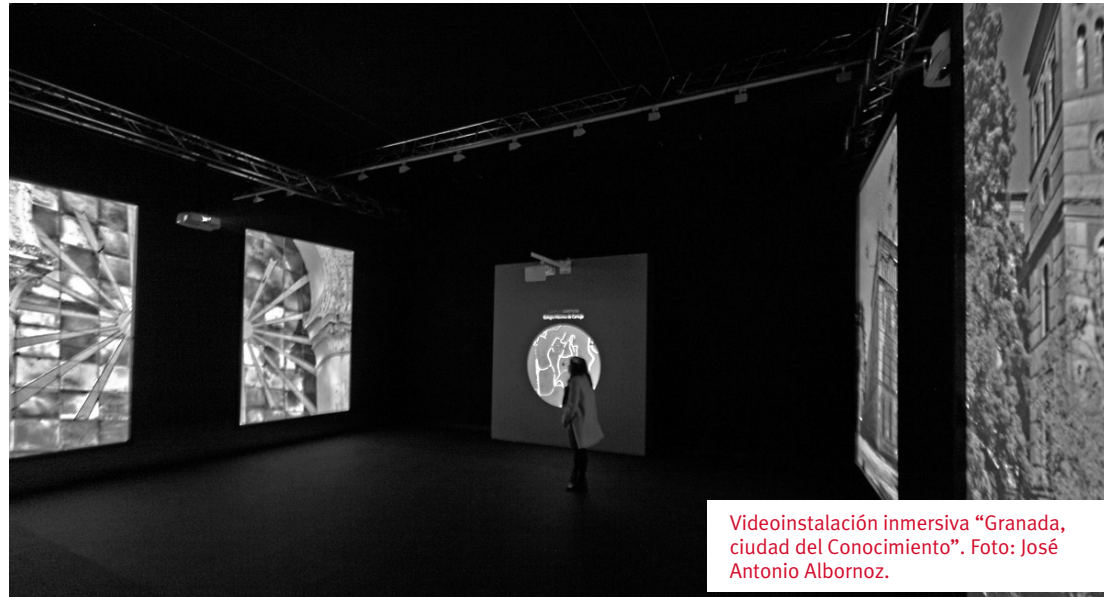
Videoinstalación inmersiva “Granada, ciudad del Conocimiento”.

El laboratorio, entendido este como centro de estudio y análisis, también incluye el entorno natural de Sierra Nevada, considerándose como un observatorio privilegiado para la astronomía y la astrofísica, aunque también distingue el estudio en otras áreas de conocimiento como geología, botánica, zoología, geografía e historia, entre otras. Sierra Nevada, como laboratorio natural nos permite experimentar la astronomía y el cambio global. En esta exposición, mediante la reproducción de acequia de montaña, se refuerza la idea del espacio de la biodiversidad, relevancia por la que es conocida internacionalmente, así como también por el conocimiento científico sobre las causas y consecuencias del cambio global.