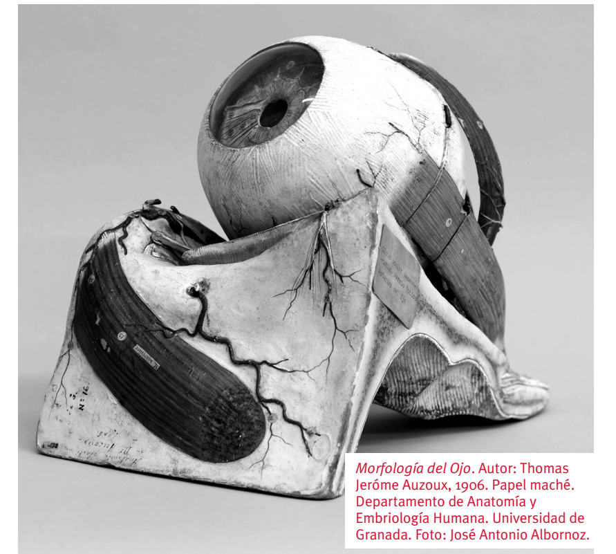
Morfología del Ojo . Autor: Thomas Jérôme Auzoux, 1906. Papel maché. Departamento de Anatomía y Embriología Humana. Universidad de Granada.