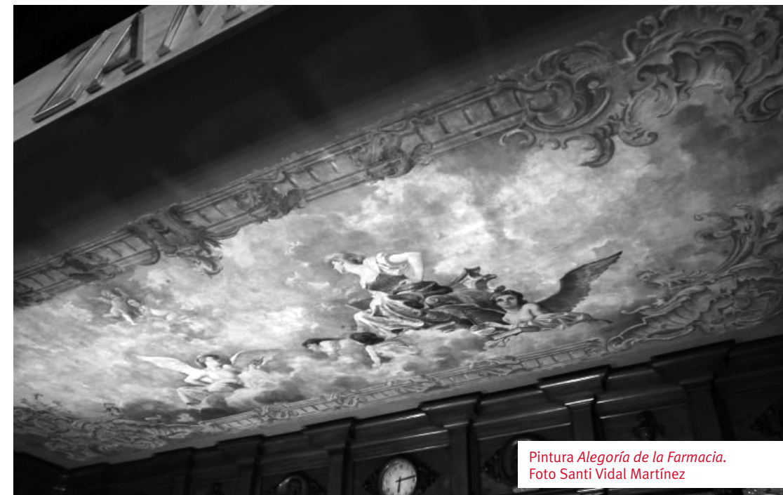
Pintura Alegoría de la Farmacia . Foto Santi Vidal Martínez