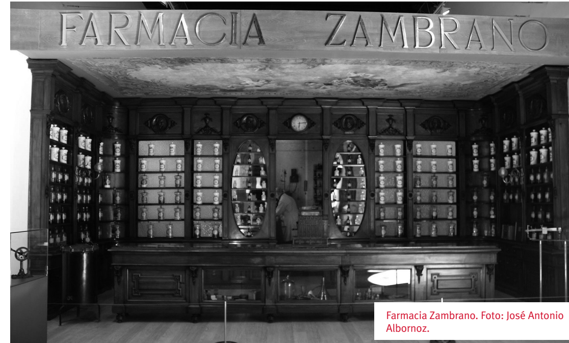
Farmacia Zambrano.

Una última sección, De la sala de estudio a la biblioteca electrónica , invita al visitante a subir a la primera planta donde se encuentra la Biblioteca