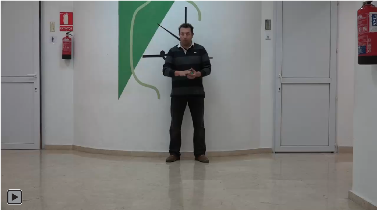
Figura 3. Juego motor con patrón de malabares con lanzamiento de una bola al suelo con la mano NO hábil con rebote imperativo y recepción con mano NO hábil, (figura RI2).

Lanzamiento de una bola al suelo con la mano NO hábil con rebote imperativo y recepción con mano NO hábil, ver figura 3 o RI2.