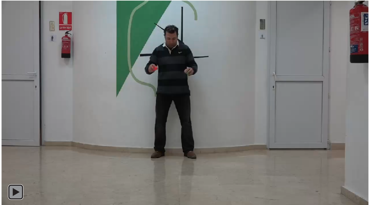
Figura 6. Juego motor con patrón de malabares con lanzamiento de dos bolas al suelo con ambas manos con rebote imperativo y recepción de la bola con la mano que no la ha lanzado, cambiándose las bolas de mano (figura RI5)

Lanzamiento de dos bolas al suelo con ambas manos con rebote imperativo y recepción de la bola con la mano que no la ha lanzado, cambiándose las bolas de mano, ver figura 6 o RI5.