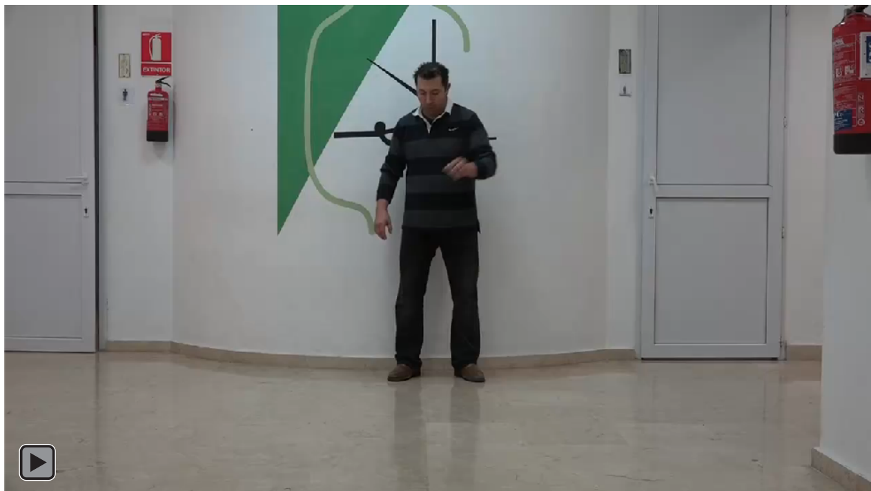
Figura 4. Juego motor con patrón de malabares con lanzamiento de una bola al suelo con la mano hábil con rebote imperativo y alternando recepción con mano NO hábil, y al revés (figura RI3)

Lanzamiento de una bola al suelo con la mano hábil con rebote imperativo y alternando recepción con mano NO hábil, y al revés, ver figura 4 o RI3.