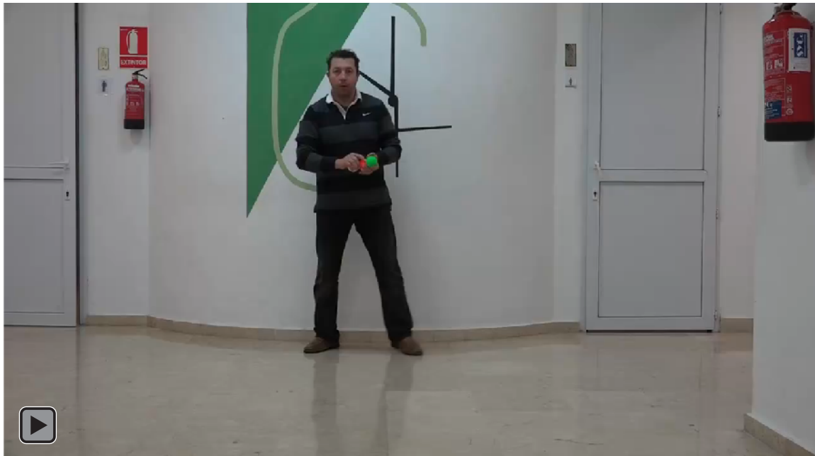
Figura 1. Juego motor con patrón de malabares de Rebote Imperativo con Tres Bolas en el Suelo (figura RI6)

La figura 1 o figura RI6 es el objetivo final, conseguir realizar malabares con 3 bolas con Rebote imperativo en el Suelo.