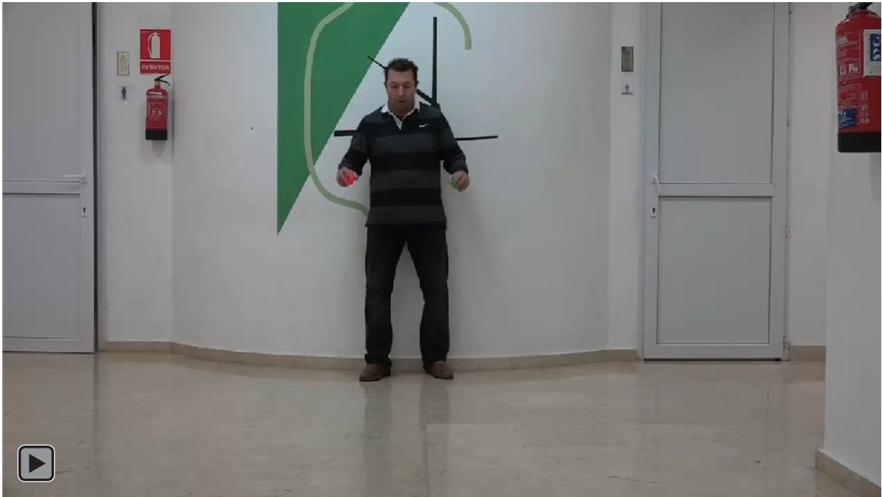
Figura 5. Juego motor con patrón de malabares con lanzamiento de dos bolas al suelo con ambas manos con rebote imperativo y simultáneo (figura RI4)

Lanzamiento de dos bolas al suelo con ambas manos con rebote imperativo y simultáneo, ver figura 5 o RI4.