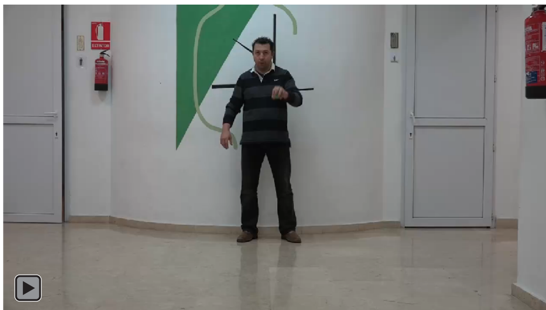
Figura 4. Juego motor con patrón de malabares con lanzamiento de una bola al suelo con la mano hábil con rebote activo y alternando recepción con mano NO hábil, y al revés (figura RA3)

Lanzamiento de una bola al suelo con la mano hábil con rebote activo y alternando recepción con mano NO hábil, y al revés, ver figura 4 o RA3.