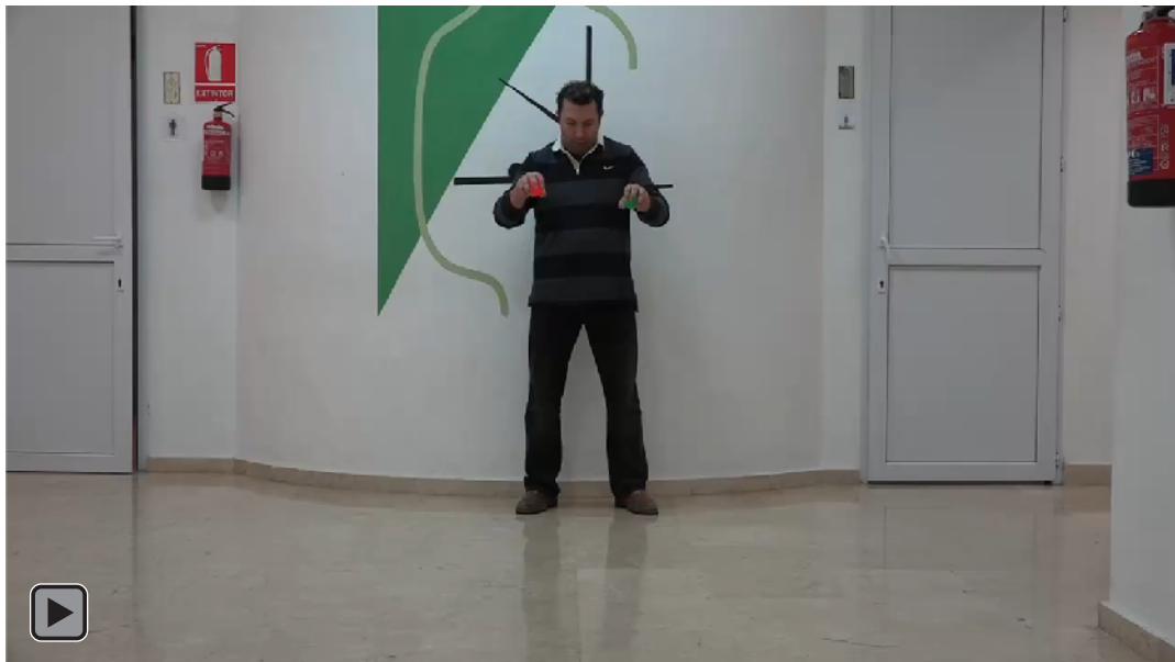
Figura 6. Juego motor con patrón de malabares con lanzamiento de dos bolas al suelo con ambas manos con rebote activo y recepción de la bola con la mano que no la ha lanzado, cambiándose las bolas de mano (figura RA5)

Lanzamiento de dos bolas al suelo con ambas manos con rebote activo y recepción de la bola con la mano que no la ha lanzado, cambiándose las bolas de mano, ver figura 6 o RA5.