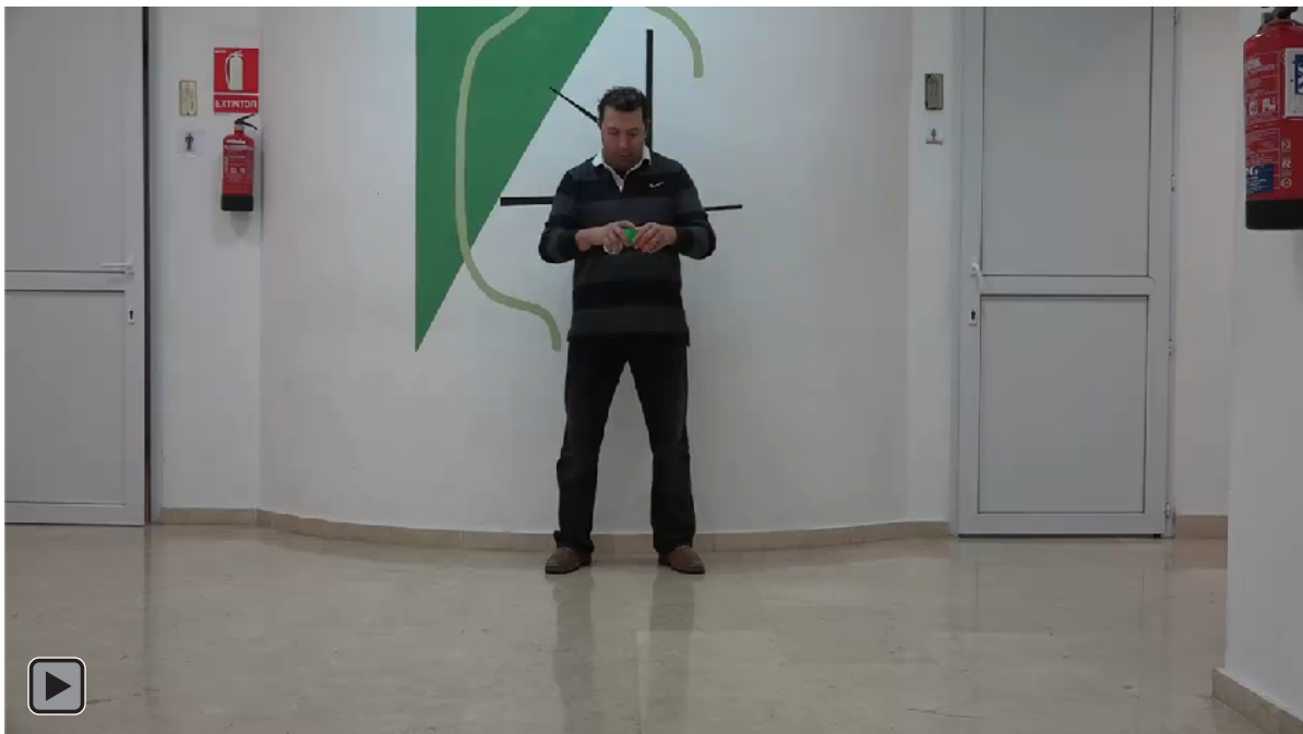
Figura 1. Juego motor con patrón de malabares de Rebote Activo con Tres Bolas en el Suelo (figura RA7)

La figura 1 o figura RA7 es el objetivo final, conseguir realizar malabares con 3 bolas con Rebote Activo en el Suelo.