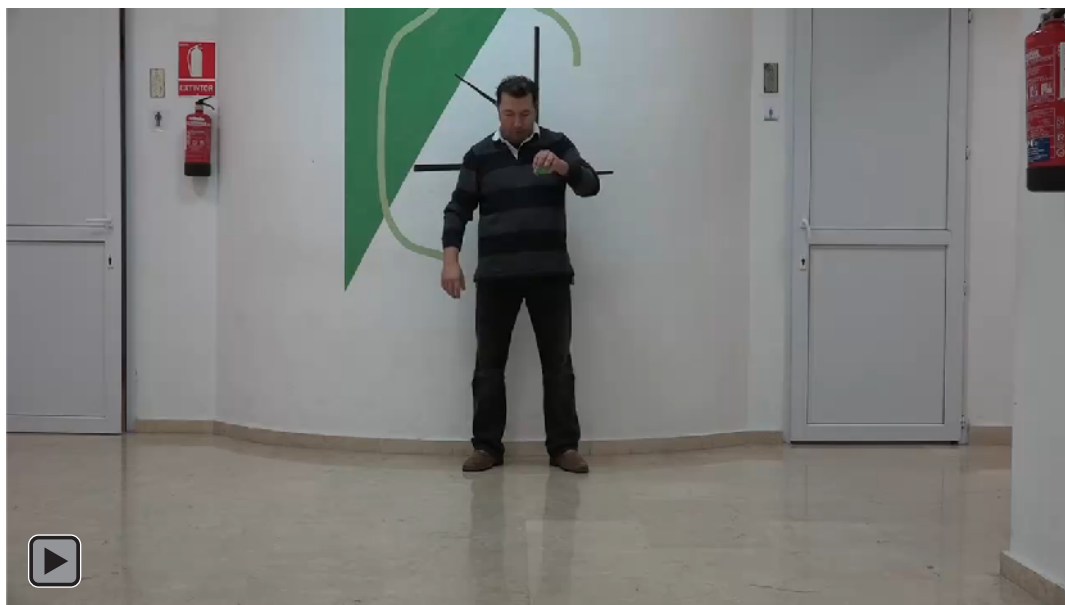
Figura 3. Juego motor con patrón de malabares con lanzamiento de una bola al suelo con la mano NO hábil con rebote activo y recepción con mano NO hábil, (figura RA2).

Lanzamiento de una bola al suelo con la mano NO hábil con rebote activo y recepción con mano NO hábil, ver figura 3 o RA2.