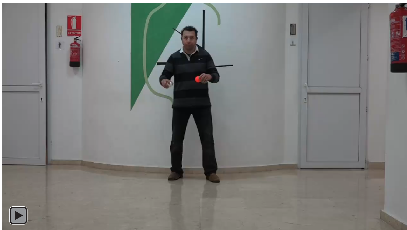
Figura 7. Juego motor con patrón de malabares con rebote activo con 3 bolas 3 a 5 lanzamientos y recepciones y parada (figura RA6)

Malabares con rebote activo con 3 bolas 3 a 5 lanzamientos y recepciones y parada, ver figura 7 o RA6.